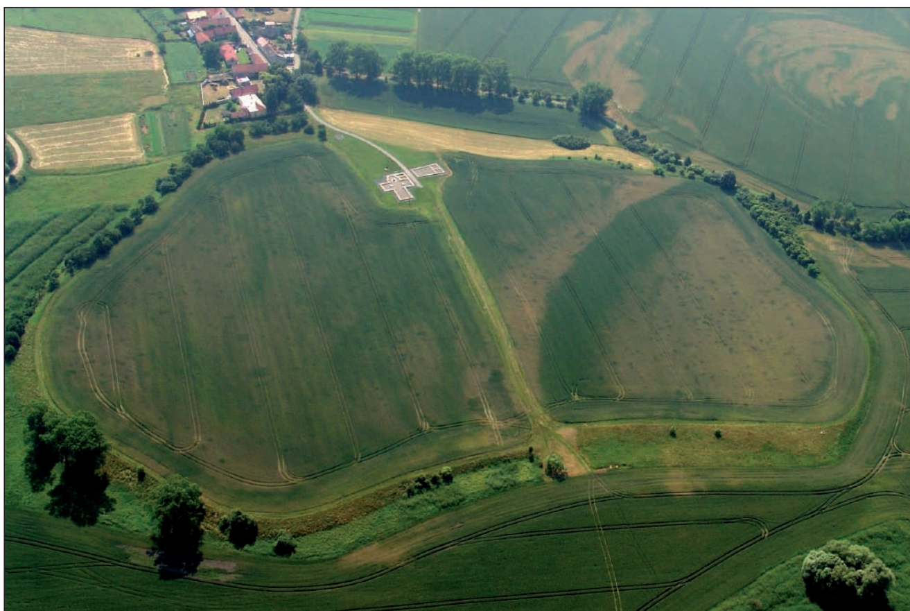
Obr. 3 Libice nad Cidlinou 2007 – vnitřní hradiště (Foto: M. Gojda).

Na rozdíl od situace na vnitřním hradišti pokrývají archeologické sondy předhradí rovnoměrně. Avšak navzdory skutečnosti, že se podařilo prozkoumat cca 7% celkové plochy předhradí, lze na základě dosavadních výsledků zpracování archeologického