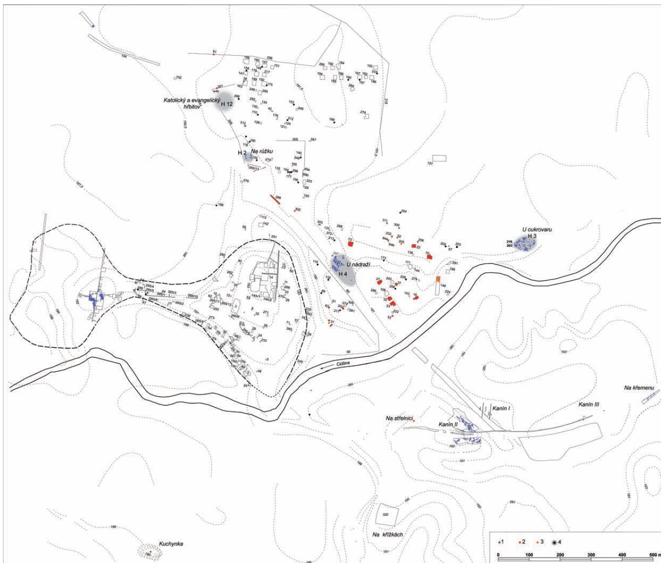
Obr. 5 Libice nad Cidlinou – celkový plán zkoumaných ploch. 1 – raně středověké hroby, 2 – sondy s raně středověkými zahloubenými objekty mimo opevněný areál hradiště, 3 – sondy s raně středověkou kulturní vrstvou, 4 – výzkumy J. Hellicha.

procházel podél zazemněné vodoteče mezi polohami Kanín I a II . Mimo časně laténského sídliště byl nalezen již v inundaci Cidliny pouze jeden nedatovatelný kostrový hrob a jeden mladohradištní zahloubený sídlištní objekt.