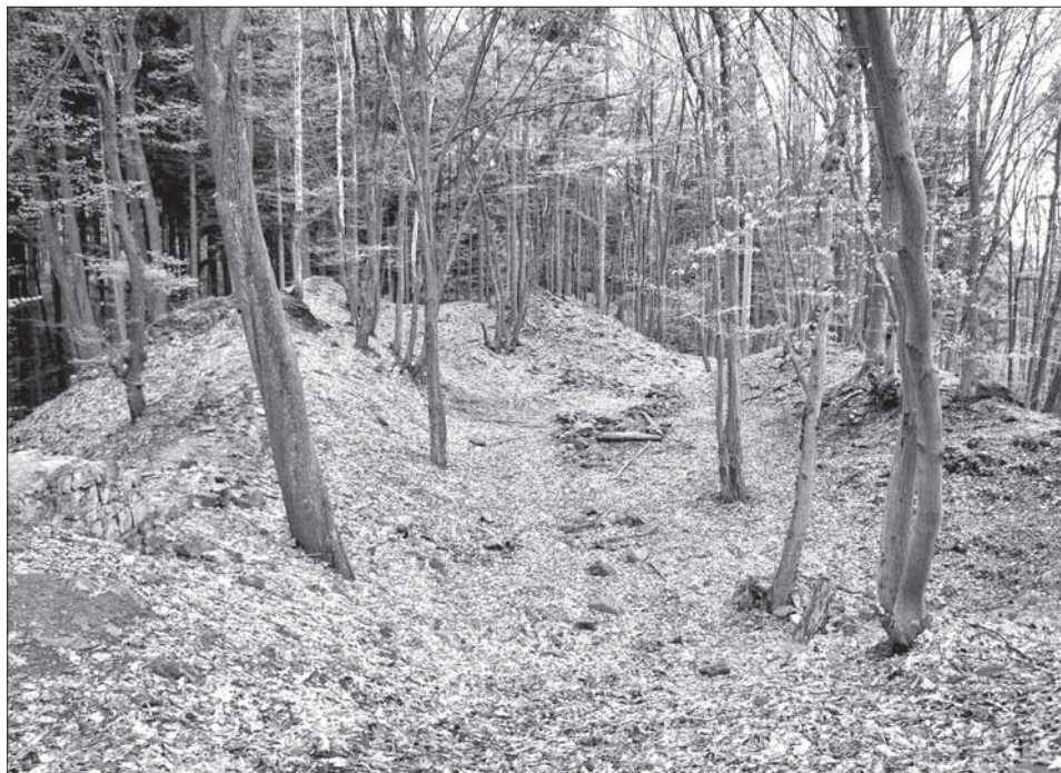
Obr. 1. Zřícenina hradu Stará Dubá, okr. Benešov. Foto V. Razím, 2006.