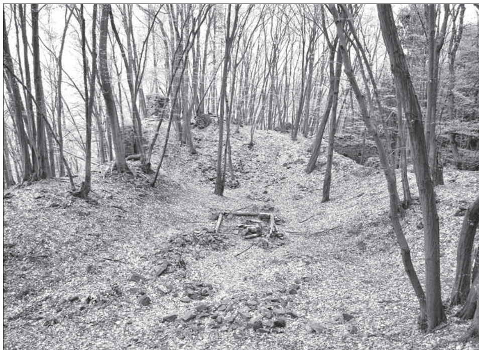
Obr. 2. Zřícenina hradu Stará Dubá, okr. Benešov. Foto V. Razím, 2006.