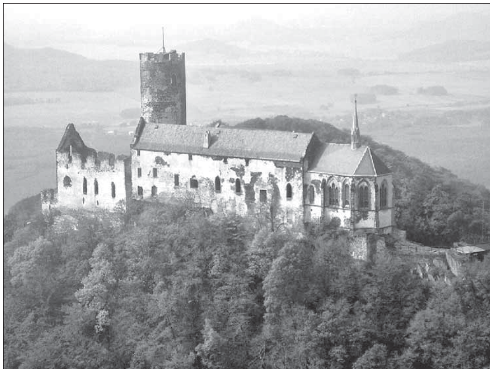
Obr. 4. Hrad Bezděz od jihovýchodu. Jižní palác dolního hradu před zastřešením.