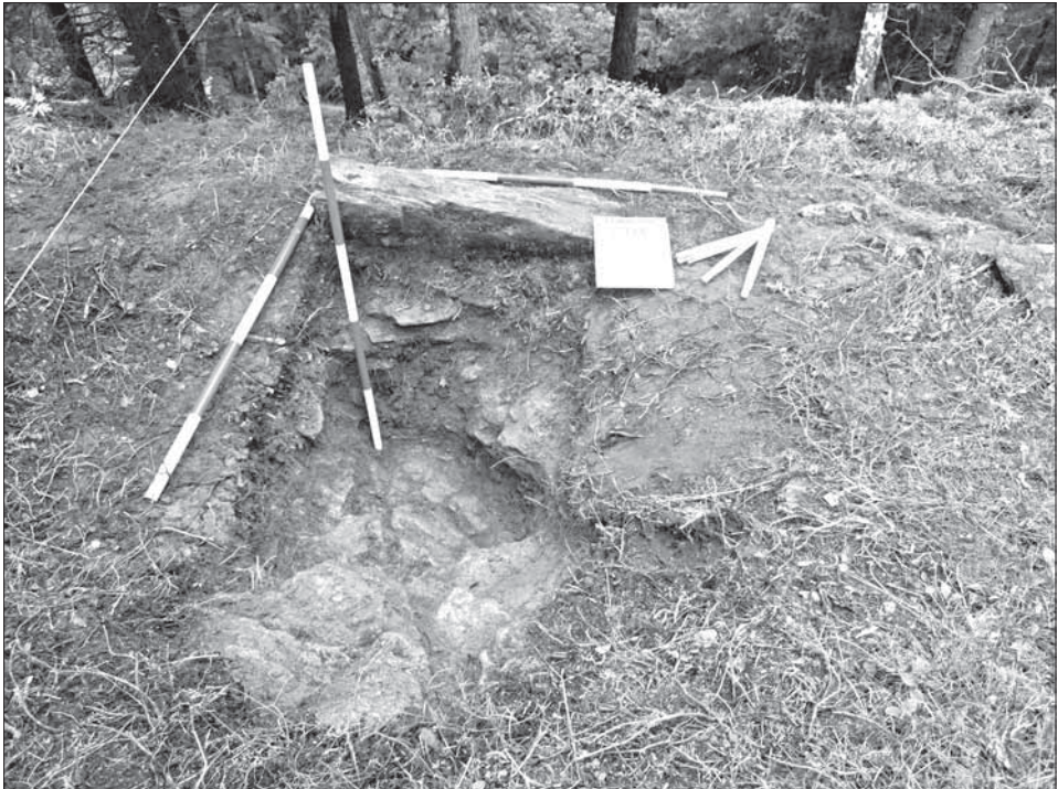
Obr. 3. a 4. Okop pro klečícího střelce z pušky před výzkumem a po odkryvu poloviny objektu, zajímavý je velký kámen použitý k ochraně střelce.