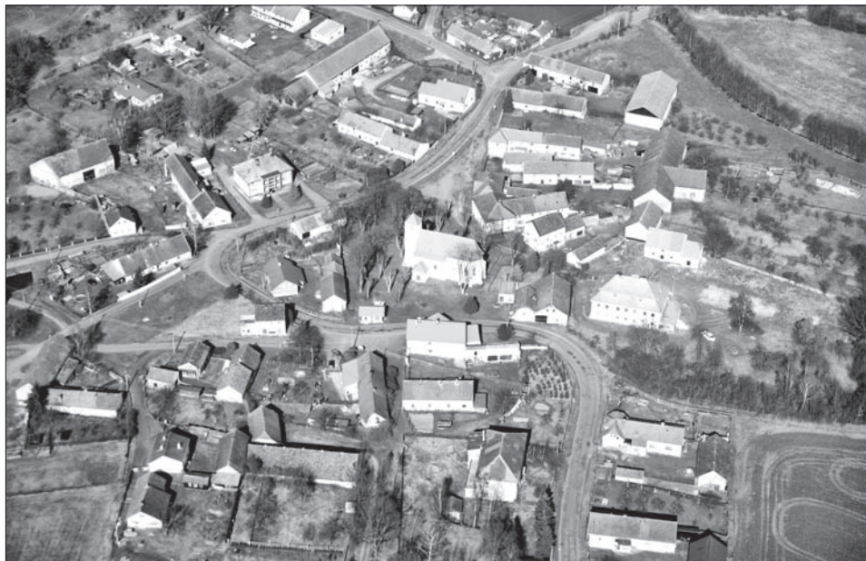
Obr. 2. Bukovec, okr. Domažlice. Letecký pohled. Foto M. Čechura, 2007. Abb. 2. Bukovec, Bez. Domažlice. Luftaufnahme. Foto M. Čechura, 2007.

a novému vyhodnocení předchozích sond; další, rozšiřující sondáž pak umožnila upřesnit nejednoznačnou interpretaci tehdy získaných poznatků (Čechura 2007, 471; Kaigl 2007, 463).