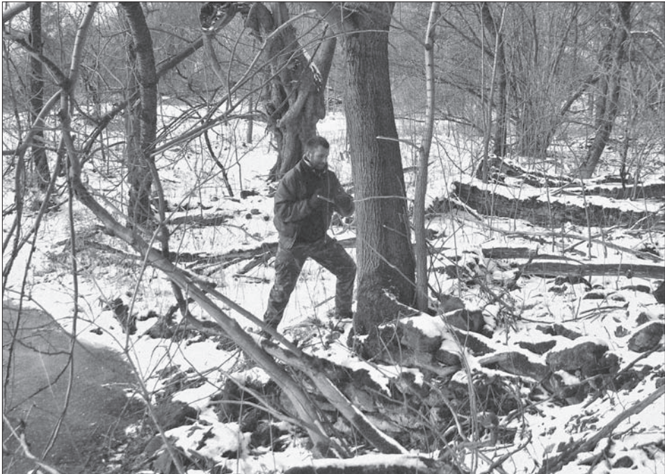
Obr. 2. Ukázka odběru vzorku na objektu stupně A. Foto L. Funk. Abb. 2. Beispiel einer Probenentnahme an einem Objekt der Stufe A. Foto L. Funk.