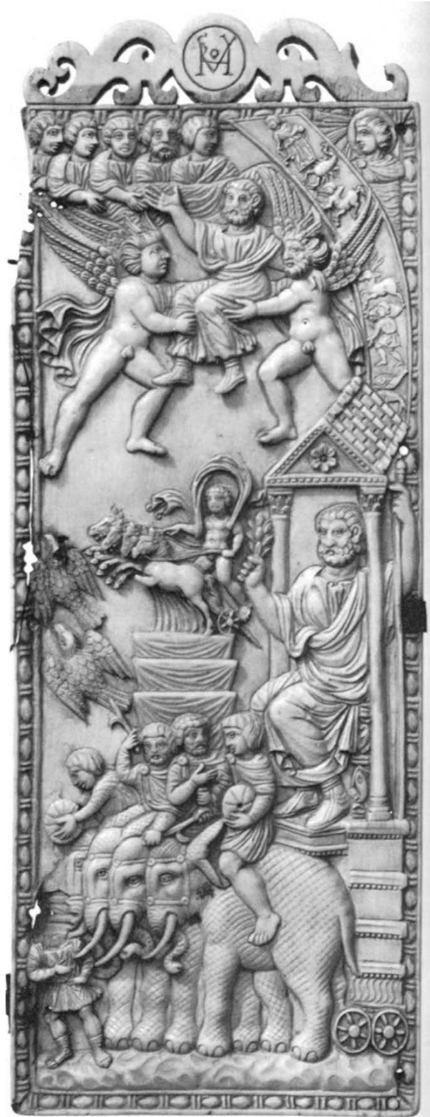
6 – Apothéose d'un empereur (?), début V siècle. British Museum, Londres

On sait que Dioclétien met radicalement en cause ce modèle à la fin du IIIe siècle en se faisant appeler Dominus et en exigeant la prosternation. Il ne