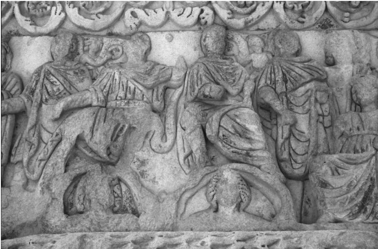
3 - Dioclétien et Galère trônant au-dessus des personnifications du ciel et de la terre, 299-305. Arc de Galère, Thessalonique

a réagi plus efficacement que l'Occident aux réformes mises en place par Dioclétien et achevées par Constantin et a su appliquer les mesures nécessaires. Les pesanteurs idéologiques, sociales, intellectuelles peuvent jouer un rôle très négatif, s'appuyant sur ce que Pierre Bourdieu appelle des habitus . 17 Ce sont des conduites, des idées suffisamment intériorisées pour qu'elles paraissent évidentes et aller de soi. Elles exercent encore plus d'emprise sur les esprits lorsque, grâce à elles, des avantages acquis paraissent légitimes. C'est ce mécanisme qui explique l'attitude de l'aristocratie romaine de l'antiquité tardive beaucoup plus que leur opposition à Constantinople en raison de son christianisme. 18 On peut dire, en forçant un peu le trait, que ces familles ont tenté de protéger leur richesse insolente, marquée par le luxe de leurs maisons. 19 Si la famille des Valerii passait pour être particulièrement riche, ce sont les vestiges survivants de la famille des Bassi qui en donnent les témoignages les plus concrets. De la demeure d'un Junius Bassus subsistent d'extraordinaires panneaux en opus sectile ; 20 [fig. 1] d'un autre Junius Bassus, préfet de Rome, mort en 359, et sans doute fils du précédent, un des sarcophages les plus somptueux du IV e siècle. 21