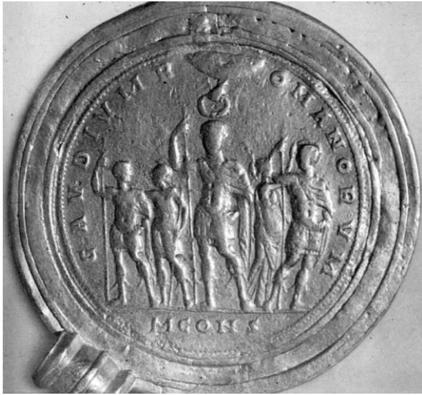
4 – Constantin Ier couronné par la main de Dieu, avant 337. Kunsthistorisches Museum, Vienne

[fig. 2] Cette richesse est encore rendue sensible par une église de Rome, Santa Balbina, dont les murs, fenêtres incluses, sont celles de la pièce majeure d'une de ces grandes maisons aristocratiques. 22