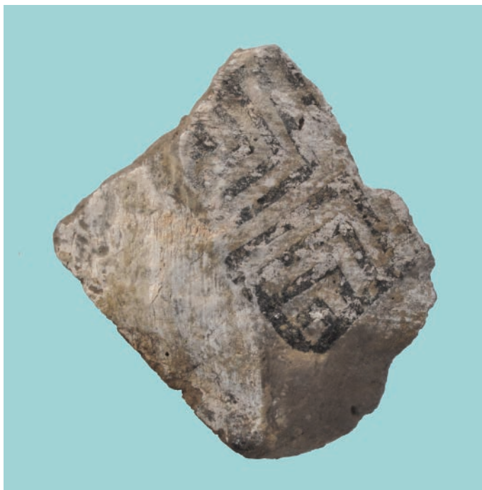
Obr. 2. Janíky - Dolné Janíky, mohyla IV. Súčasný stav zachovania negatívneho odtlačku maľby steny hrovej komory. Šírka artefaktu je 17,9 cm.

miestna časť Dolné Janíky (okres Dunajská Streda). Negatív sa podarilo vypreparovať z jej juhovýchodného nárožia, a to z výšky cca 40 cm nad podlahou. Stopy bieleho vápenného náteru sa vyskytovali aj v ďalších častiach priestoru komory, obzvlášť medzi okrajmi jednotlivých polkmeňov, ktoré boli vyplnené hlinitým materiálom a vyhladené. Výnimočne sa na niektorých miestach medzi druhým a tretím polkmeňom objavovali nepatrné zvyšky čiernej farby. Z charakteru zásypových vrstiev v jednotlivých častiach vnútorného priestoru komory vyplýva, že zrútením časti horizontálneho dreveného stropu, asi v dôsledku aktívít pri budovaní pravouhlej drevenej nadstavby pre uloženie následného pohrebu (Studeníková 2011, 242), bol zasiahnutý severný okraj jej strednej časti. Práve na tomto mieste došlo k takmer úplnej deformácii veľmi slabo vypálených častí tzv. kalenderberskej trojice, predovšetkým mesiacovitého idolu. Naopak pozdĺž obvodových stien a v nárožiach, ktoré boli spevňované z vonkajšej strany rôzne opracovávanými drevenými brvnami, preboril sa strop pravdepodobne oveľa neskôr. Miestami vznikli v komore preto aj celkom duté priestory. Vďaka nim sa zachovala nielen ucelenejšia sekundárna výzdoba keramiky, ale dali sa tiež pozorovať a čiastočne aj zdokumentovať zvyšky niektorých organických materiálov (košík, spráchnivené zvyšky šnúr, tkanín a kože).