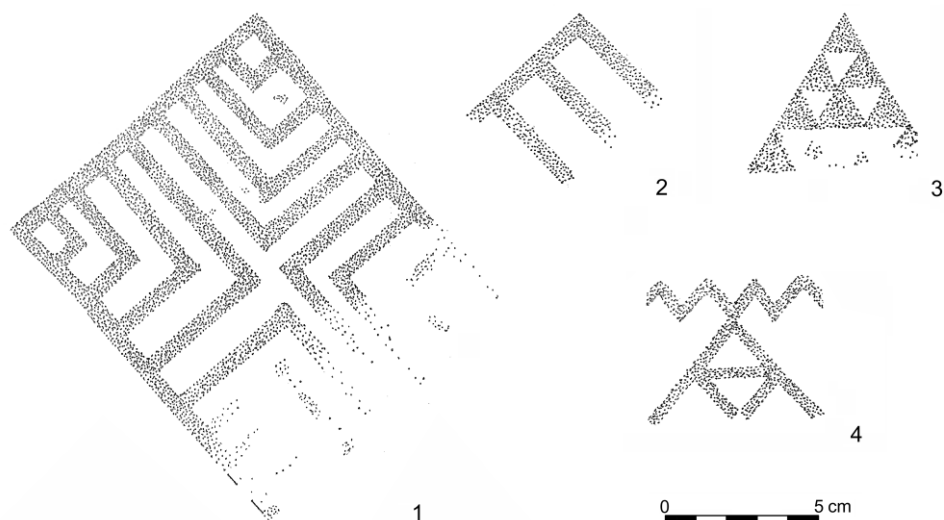
Obr. 3. Janíky - Dolné Janíky, mohyla IV. 1 – kresba pôvodnej podoby negatívu maľby hrobovej komory; 2–4 – výber z motívov sekundárnej čiernej maľby na hrobovej keramike.