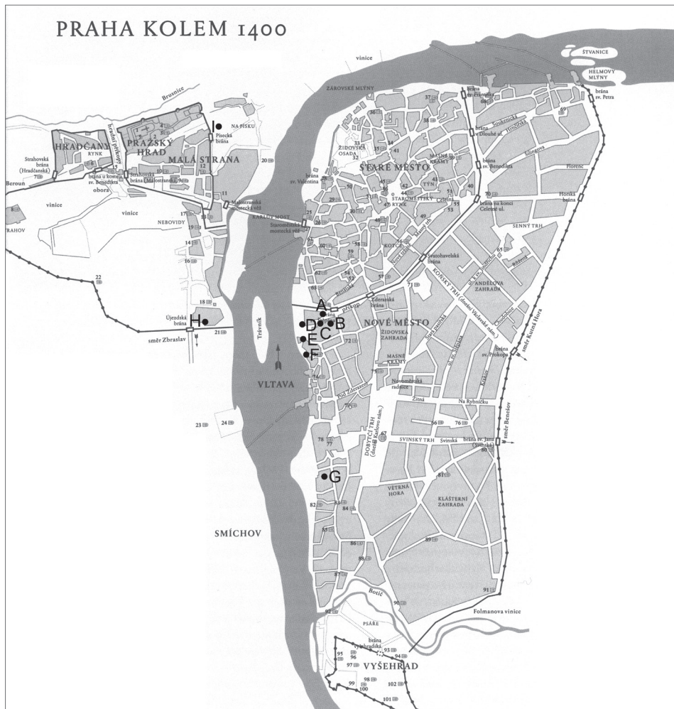
Obr. 1. Vápenky a cihelny v pozdně středověké Praze. Podklad mapy podle Karel IV. 2006, 199.