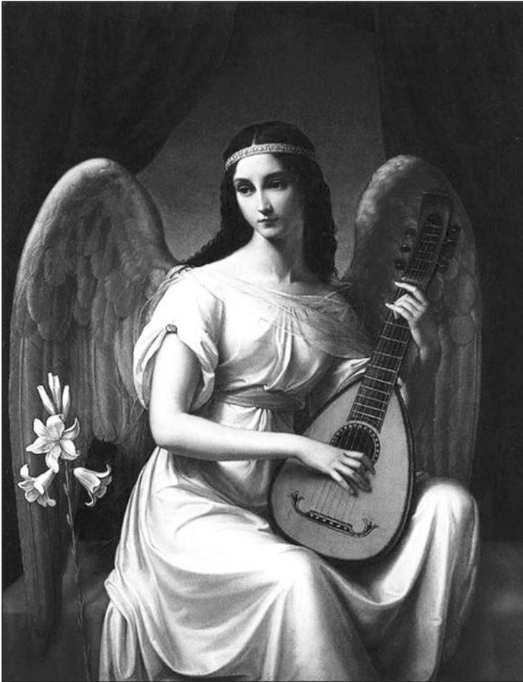
Friedrich Wilhelm von Schadow: Mignon, 1828