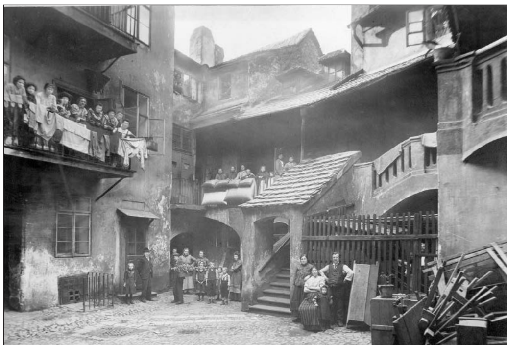
Pohled do dvora domu s pavlačí v Cikánské ulici, čp. 182, v Josefově před asanací; fotoatelier Eckert, Archiv hlavního města Prahy, sign. VI 52/1.

literaturách té doby: Máchova či Tylova Praha je tak podle Macury konstruována paralelně s Dickensovým Londýnem, Sueovou Paříží či Gogolovým Petrohradem: „Rodí se současně povědomí o estetice města, které už nestojí v protikladu ke krajině, ale jeví se jako její součást“ (MACURA 1995: 178). Obraz Prahy založený doposud na několika emblémech (personifikace Prahy, Praha matka měst, stříbropěnná Vltava atd.) se rozšířil o vrstvu dobových reálií. Především žánr obrazu/črty v rámci prózy a lokální fraška dramatu otevřela prostor pro reflexi každodennosti metropole. Na jedné straně představily střediska soudobého společenského života (zvl. Kanálská zahrada, Barvířský ostrov, Hvězda), na straně druhé zavedly poprvé čtenáře na sociální periferii (Na Františku, Uhelný trh, Vyšehrad aj.). Vedle žánrových výjevů příznačných situací a festivit (nedělní promenáda, masopust, fidlovačka) se otevírají sociálně problematické otázky a zobrazovány jsou postavy z okraje společnosti (vedle dělníků, řemeslníků a trhovkyň falešní hráči, alkoholici nebo prostitutky).