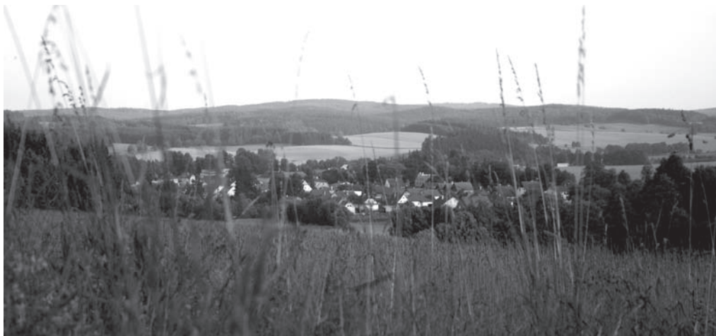
Obr. 5. Horní poříčí Jihlavy na Hornocerekevicku. V pozadí masiv Javořická tabule (Jihlavské vrchy).

Fig. 5. Upper reaches of the river Jihlava in the surroundings of Horní Cerekev. In the background is the massif of Javořice Plateau (Jihlava Hills).