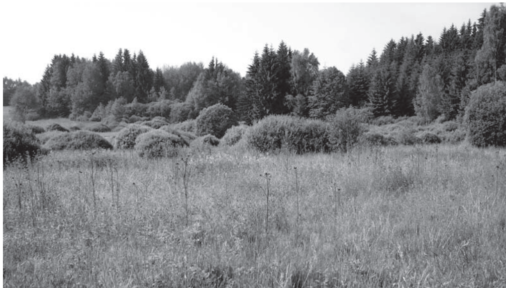
Obr. 6. Zrašeliněná louka v pramenné oblasti Hraničního potoka u Čejkova ve výšce okolo 650 m.