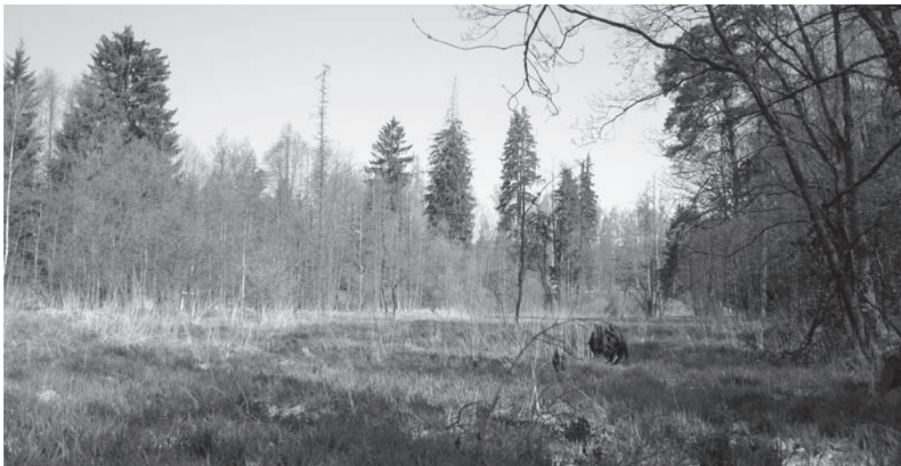
Obr. 7. Pohled na zazemněnou nivu Roušfanského potoka u Roušťan, Havlíčkovobrodsko. Foto P. Hejhal 2009, archiv ARCHAIA Brno.