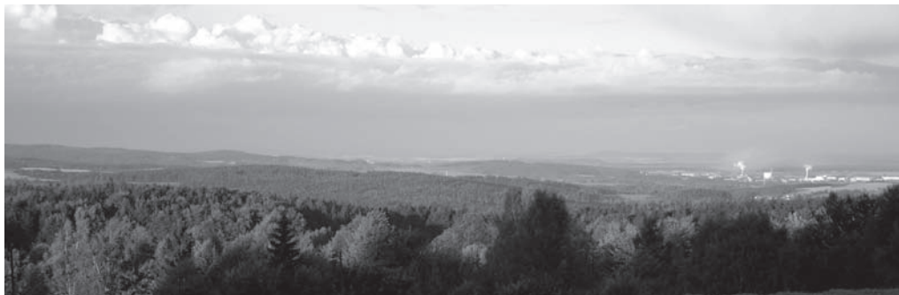
Obr. 3. Pohled na Jihlavskou kotlinu od Nového Hojkova.

Fig. 3. A view of the Jihlava Basin from Nový Hojkov.