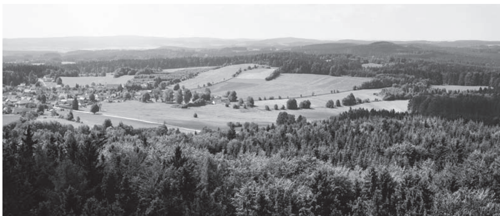
Obr. 4. Pohled do mikroregionu potoků Hraniční a Rohozná jihovýchodně od Křemešnicka (765 m). V popředí ves Sázava.

Fig. 3. A view of the Jihlava Basin from Nový Hojkov.