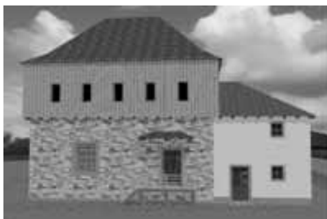
Obr. 5. Srovnání současného stavu tvrze s možnou podobou po rekonstrukci.

Abb. 5. Vergleich des derzeitigen Zustandes der Festung mit möglichem Aussehen nach der Rekonstruktion: oben – Westfassade des Turms, unten – Südfassade mit Eingang in den Turm und den barocken Anbau.