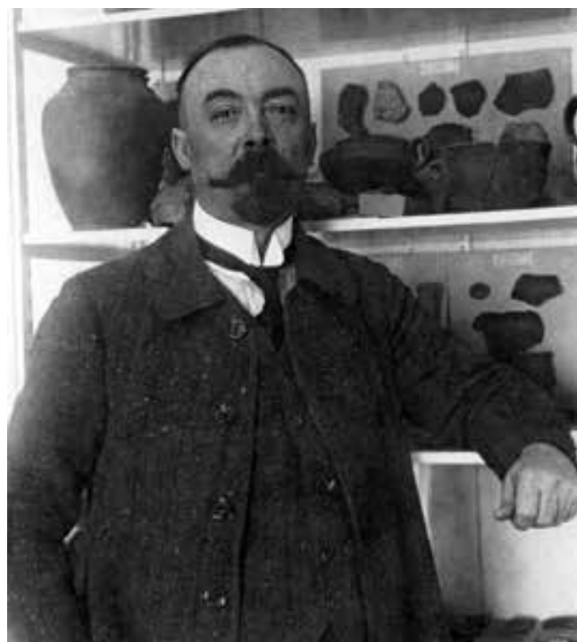
Obr. 8: Inocenc Ladislav Červinka, jeden z nejvýznamnějších moravských archeologů, provedl jako první archeologický výzkum na lokalitě Ondratice I/Želeč. Fotografie z konce 20. let 20. století.