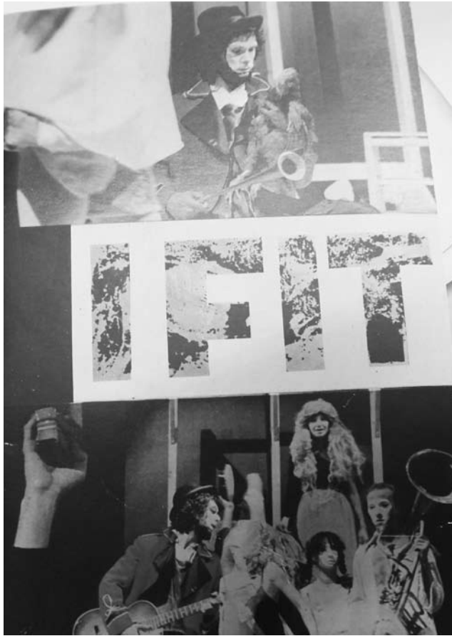
Obr. 1. Obálka bulletinu IFIT 1/1978. Divadelní ústav Zbigniewa Raszewskiego ve Varšavě, Archiv alternativního divadla, Teatr 77 v Lodži.

Že nešlo jen o pouhé fráze, dosvědčuje už v prvním čísle bulletinu výzva k zaslání protestu ministru kultury Španělska, jehož předmětem bylo odsouzení čtyř herců z divadla Els Joglars z Barcelony. I v dalších číslech bulletinu byly publikovány výzvy na podporu a pomoc ohroženým divadelním souborům.