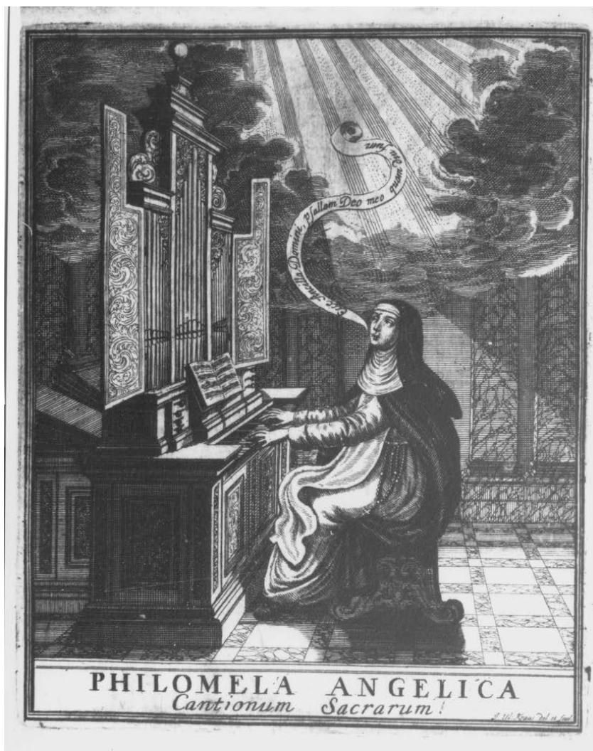
Obr. 2. Frontispice v parte pre basso continuo.