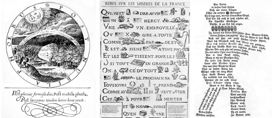
Obr. 8. Vlevo: Emblém Gabriela Rollenhagena. Emblematum centuria secunda (1613).