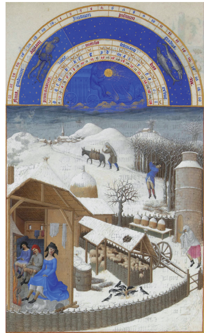
Obr. 5. Vpravo: Bratři v Limburka. Ukázka z iluminovaného rukopisu Přebohaté hodinky vévody z Berry . Měsíc únor.

V prvním případě je termín umělecká ilustrace synonymní s termínem „ilustrace knižní“. Jednotčím kritériem pro rozpoznání takového druhu ilustrace je médium knihy, neboli fyzická blízkost textu a obrazu, jako je tomu např. na pozvánkách, reklamách, letáčích apod. V případě, že bychom připustili tuto definici, museli bychom se vypořádat také s mnoha dekorativními a typografickými prvky, které se nezdídka na stránkách knih vyskytují a zdánlivě mohou být za ilustraci považovány; museli bychom se např. rozhodnout, zda je za ilustraci možné pokládat středověké rozviliny a drolierie, rokokové vignety (v záhlaví fleuron , v závěru textu