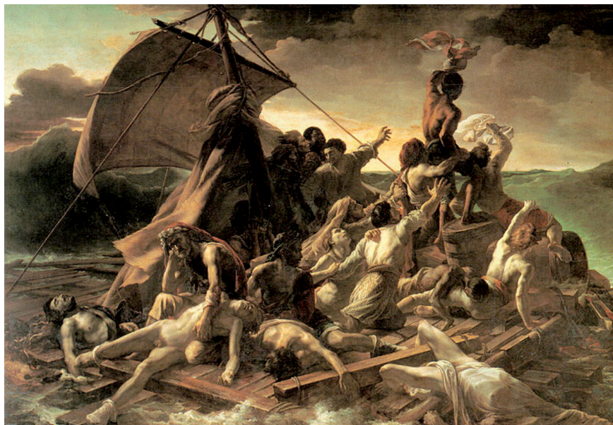
Obr. 6. Nahoře: Theodore Géricault. Ilustrace ke knize Le Naufrage de la frégate «la Méduse» faisant partie de l'expédition du Sénégal, en 1816 (1821).