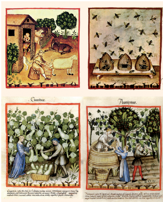
Obr. 4. Vlevo: Ibn Butlan v Bagdádu. Výběr čtyř iluminací z příručky Tacuinum Sanitatis : chovatel ovcí, úl, dýně, podzim.