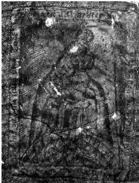
Obr. 1. Panna Marie Škapulířová (výřez), 17.–18. století, Muzeum města Brna, inv. č. 803/1. Foto Veronika Šulcová. Abb. 1. Jungfrau Maria vom Berge Karmel (Ausschnitt), 17.–18. Jhdt., Museum der Stadt Brno, Inv. Nr. 803/1. Foto Veronika Šulcová.

Putování na posvátná místa spojená podle legendy s projevem milosti Boha, Panny Marie nebo svatých mají dlouhou tradici. K poutním cílům známým ve středověku začala především v 17. a 18. století přibývat nová místa mariánského kultu, často uměle zakládaná, která byla