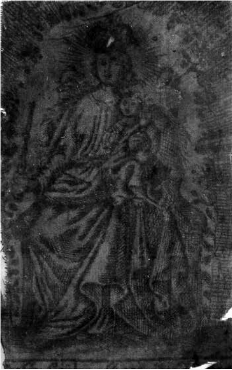
Obr. 4. Panna Marie Tuřanská (výřez), po roce 1689, Muzeum města Brna, inv. č. 806/3. Foto Veronika Šulcová. Abb. 4. Jungfrau Maria zu Turans (Ausschnitt), nach 1689, Museum der Stadt Brno, Inv. Nr. 806/3. Foto Veronika Šulcová.