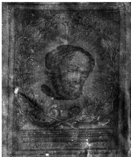
Obr. 7. Sv. Anastáz Perský (výřez), 17.–18. století, Muzeum města Brna, inv. č. 823/1. Foto Veronika Šulcová.

Abb. 6. Gottesmutter mit geneigtem Haupt (Ausschnitt), 17.–18. Jhdt., Museum der Stadt Brno, Inv. Nr. 823/1. Foto Veronika Šulcová.