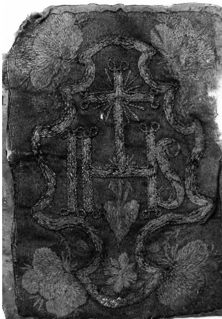
Obr. 9. Nápis IHS (výřez), 17.–18. století, Muzeum města Brna, inv. č. 1190/1.