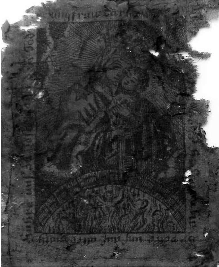
Obr. 8. Panna Marie Škapulířová a nápis IHS (výřez), 17.–18. století, Muzeum města Brna, inv. č. 1190/1.