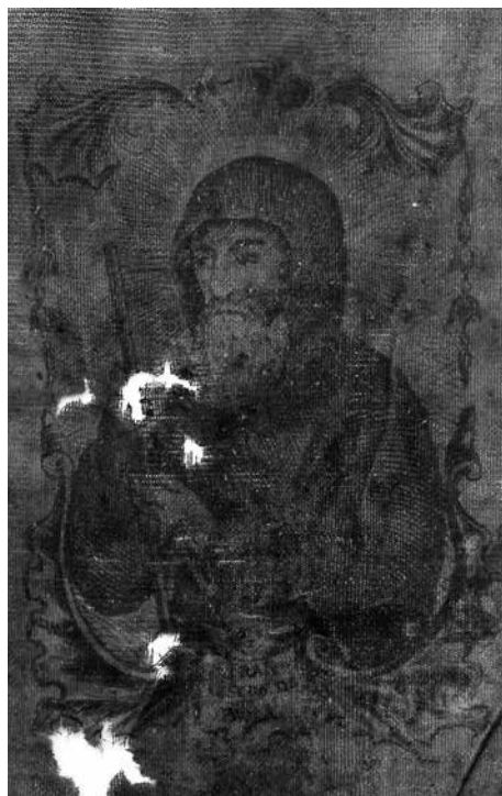
Obr. 3. Sv. František z Pauly (výřez), 17.–18. století, Muzeum města Brna, inv. č. 806/2. Foto Veronika Šulcová. Abb. 3. Hl. Franz von Paula (Ausschnitt), 17.–18. Jhdt., Museum der Stadt Brno, Inv. Nr. 806/2. Foto Veronika Šulcová.

hlavy. V pravé ruce drží Panna Marie škapuliř, směřující k duším v očistci v poukazu na jejich osvobození. Sugestivně podané vyobrazení očistce je umístěno pod obloukem ve spodní části fragmentu. Ústřední výjev lemuje špatně čitelný nápis: Er rett uns aus aller Noth / Führe uns zu Jesu nach dem Todt / Jungfrau Carmeliter Zier / Behiet uns durch h. Scapulir.