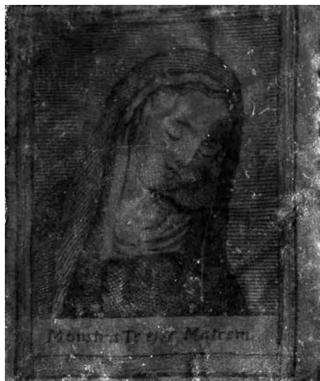
Obr. 6. Matku Boží se skloněnou hlavou (výřez), 17.–18. století, Muzeum města Brna, inv. č. 823/1. Foto Veronika Šulcová.

Abb. 6. Gottesmutter mit geneigtem Haupt (Ausschnitt), 17.–18. Jhdt., Museum der Stadt Brno, Inv. Nr. 823/1. Foto Veronika Šulcová.