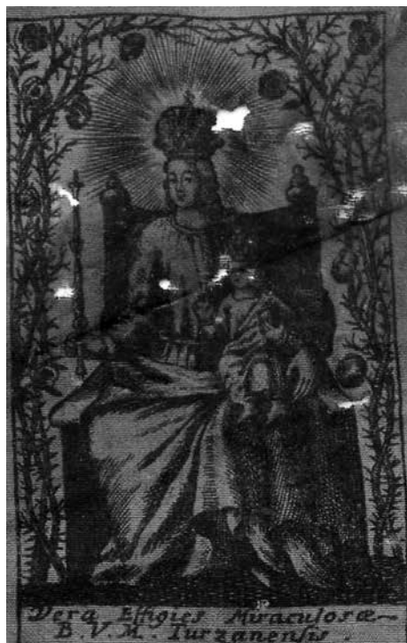
Obr. 2. Panna Marie Tužanská (výřez), po roce 1689, Muzeum města Brna, inv. č. 806/1. Foto Veronika Šulcová. Abb. 2. Jungfrau Maria zu Turans (Ausschnitt), nach 1689, Museum der Stadt Brno, Inv. Nr. 806/1. Foto Veronika Šulcová.