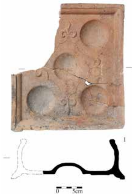
Obr. 4. Litovel. Základní kachel s pěti kruhovými prohlubněmi. 1 – Masarykova ulice. Kresba I. Hradilová, fotografie P. Rozsival.