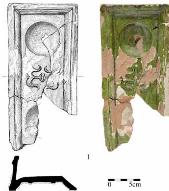
Obr. 5. Litovel. Rohové kachle s motivem dvou kruhových prohlubní. 1 – Zahradní ulice. Kresba I. Hradilová, fotografie P. Rozsival.