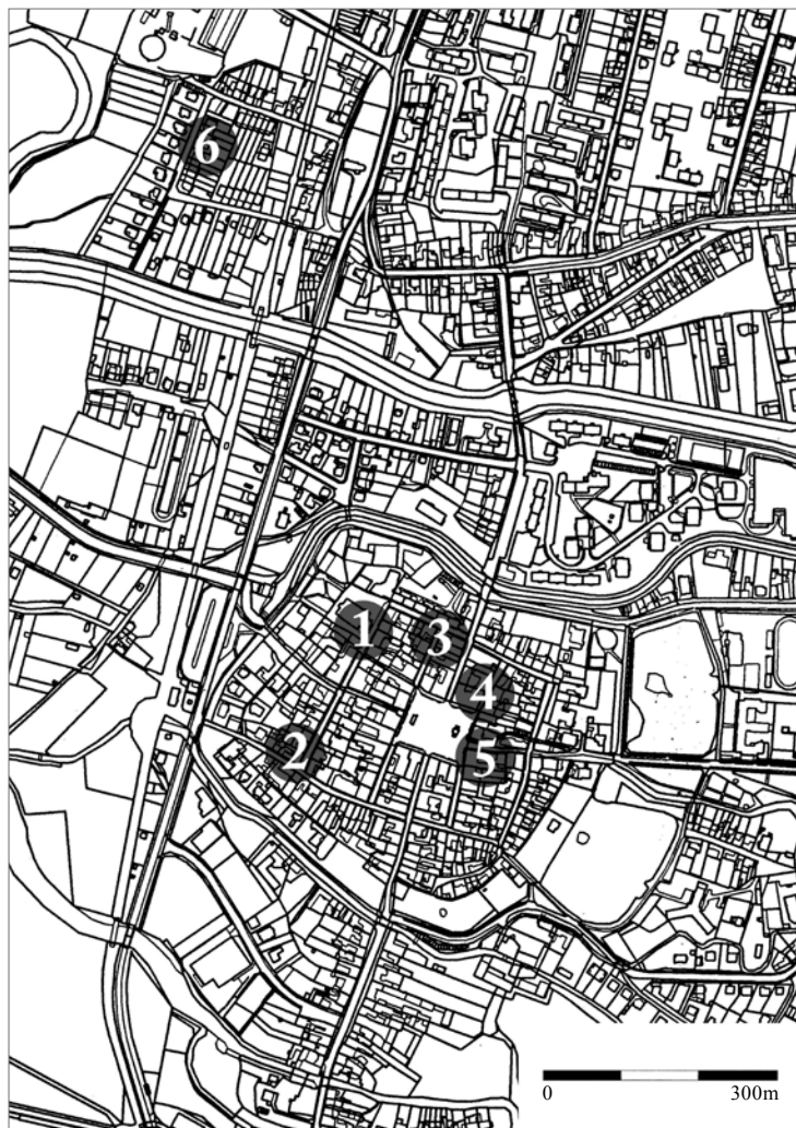
Obr. 1. Litovel. Poloha míst s nálezy kachlů s pěti kruhovými prohlubněmi. 1 – Kostel sv. Marka, 2 – Komenského ulice, 3 – Revoluční ulice, 4 – Masarykova ulice, 5 – Husova ulice, 6 – Zahradní ulice. Digitalizace J. Grégr, upravil P. Rozsival.

Abb. 1. Litovel. Lage der Fundstellen von Kacheln mit fünf kreisförmigen Vertiefungen. 1 – St. Markuskirche, 2 – Straße Komenského, 3 – Straße Revoluční, 4 – Straße Masarykova, 5 – Straße Husova, 6 – Straße Zahradní. Digitalisierung J. Grégr, bearbeitet von P. Rozsival.