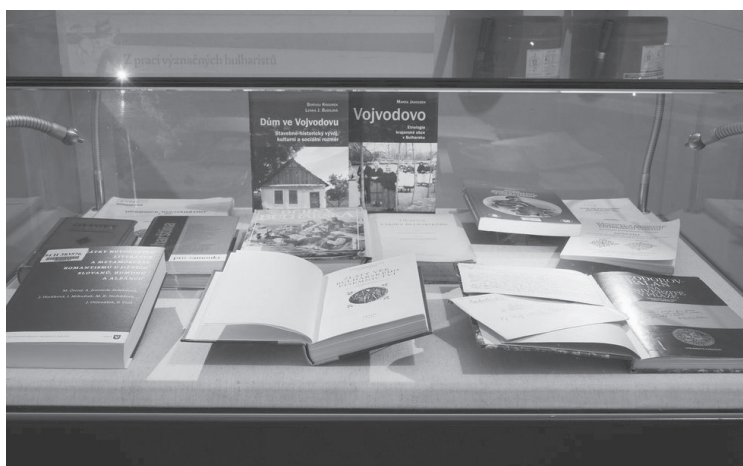
Z prací významných bulharistů, foto Eva Hodškov

ny se zřetelem k její bulharské sbírce a přidruženým bulharistickým aktivitám 1 .