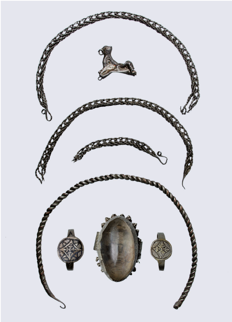
Obr. 4: Šperky z depotu z Babic, 12. století, Slováké muzeum v Uherském Hradišti, foto: Muzeum města Brna, Miloš Strnad.