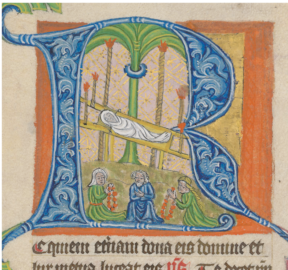
Obr. 2: Detail iluminace, Brněnský misál, sign. SK, č. 6, fol. 244, před 1435, Římskokatolická farnost u kostela sv. Jakuba v Brně, depozit Archiv města Brna, foto: Archiv města Brna.

pokládána za „pohanské milodary“. Transformace je dáována do souvislosti s postupným pronikáním věroučných zásad do představ společnosti, a tím i změnou v pohřbívání. Postupem doby se do popředí dostávala starost o spásu duše zemřelých prostřednictvím umístění jejich hrobu co nejblíže kostela, neboť jejich vykoupení měly zajistit vroucí modlitby, almužny a zbožné odkazy (Bylina 2009, 129–131). Nicméně je nutno zdůraznit, že církevní ani světská nařízení, která by omezovala ukládání věcí do hrobu, neexistovala (Sommer 2001, 46). Zmiňované oděvní řady zakazovaly pouze nižším vrstvám obyvatel nošení určitých druhů látek, oděvů a šperků, než na jaké měly nárok.