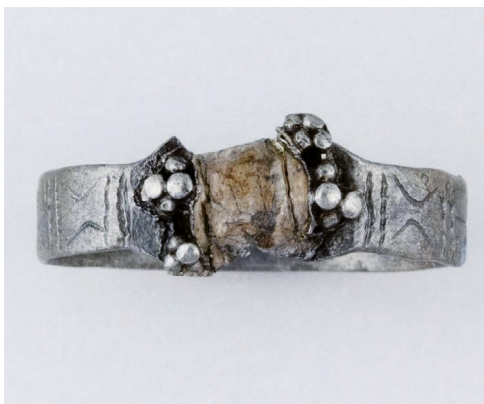
Obr. 3: Depot prstenů z Přibic, mladohradištní období, Regionální muzeum Mikulov, foto: Regionální muzeum Mikulov.

vypovídá, že tento medailon byl uložen do hrobu se zemřelým až v 2. polovině 18. století (Omelka – Šlancarová 2007, 680). Dotyčný si jej tak mohl uchovávat po celou dobu svého života a poté být s medailonem pohřben. Bohužel na rozdíl od novověkých nálezů, kde už je kombinace s písemnými prameny poměrně snadná, přesná datace výroby předmětů je v případě středověkého šperku značně problematická. V některých specifických případech lze pomocí ikonografického rozboru motivu určit datování u poutnických medailů (jak bude ukázáno na medaili se sv. Stanislavem), avšak i zde platí, že s drobnými modifikacemi mohly být vyráběny ve stejné podobě i po několik desetiletí.