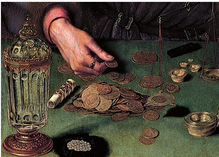
Obr. 1: Detail obrazu Směnárník se svou ženou, Quentin Massys (1456/1466–1530), 1514, Musée du Louvre Paris