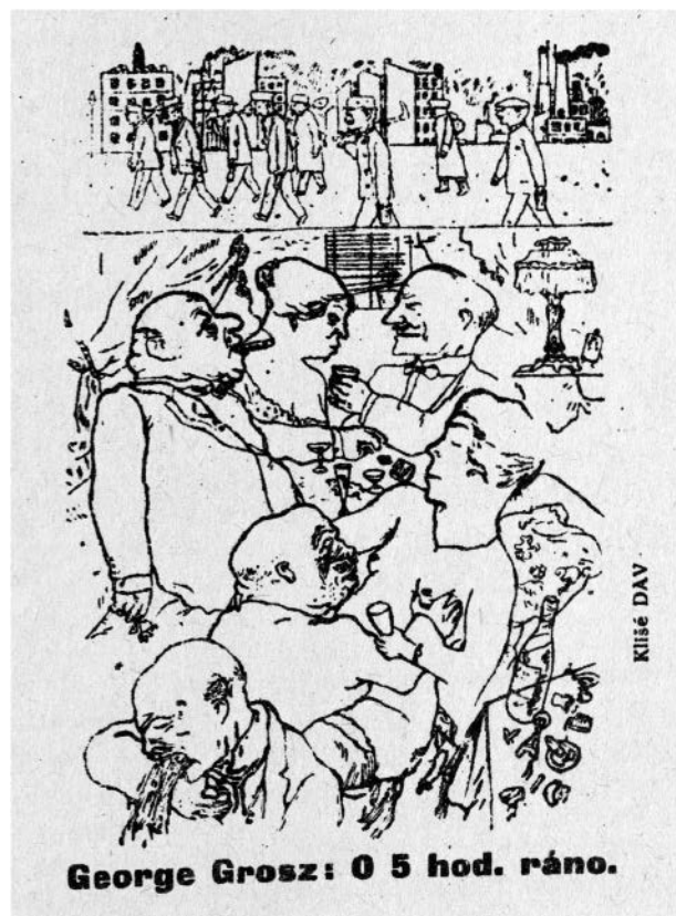
2 – George Grosz, O 5. hodine ráno, DAV 1925

Stav slovenskej modernej kultúry bol pre sociálno-tendenčné a sociálno-kritické výtvarné prejavy nepriaznivý najmä preto, lebo primárnou úlohou a otázkou dobovej tvorby bolo prepájanie moderného a národného výrazu, čo sa odzrkadlilo na folkloristických prístupoch. Ako tvrdí