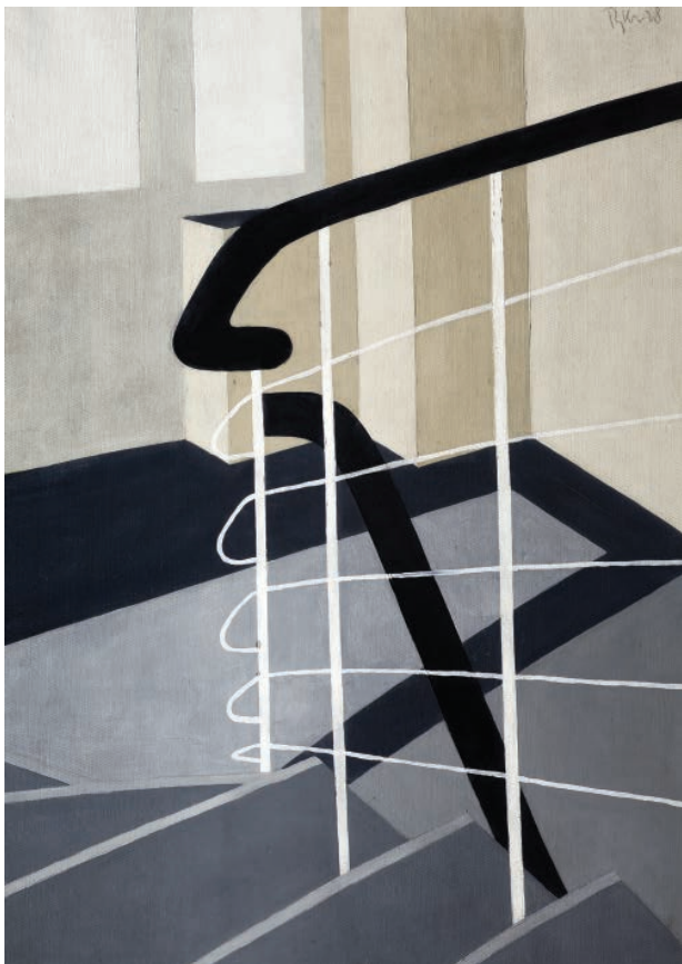
1 – Zdenek Rykr, Schodiště , 1928. Praha, Národní galerie

pjaté mezi ostrou společenskou kritikou, klasicismem konzervativního stříhu a magickým realismem, jaká se pěstovala od počátku dvacátých let v Německu. V roce 1925 byl podchycen slavnou výstavou Die Neue Sachlichkeit. Deutsche Malerei seit dem Expressionismus v Kunsthalle Mannheim, připravenou jejím ředitelem Gustavem Friedrichem Hartlaubem. Není však zcela jasné, zda ve své době Rykr vůbec tento pojem mohl znát – bohužel se zatím nemůžeme opřít o studii, která by doložila dobovou reflexi tohoto fenoménu v českém kontextu. Nicméně domněnka o bezprostředním ovlivnění se přímo nabízela. V roce 1928 se totiž Rykr zúčastnil zájezdu novinářů do Německa na velkou mezinárodní výstavu tisku Pressa . Ta je vedle světové výstavy v Barceloně 1929 považována za největší událostí na poli výstavnictví dvacátých let. Vyrostly zde samostatné pavilony v duchu funkcionalismu a můžeme jen spekulovat, zdali jej jejich podoba i celkový modernistický duch výstavy nepodnítily k oslavě puristické architektury a následně ke specifickému typu malby, jíž se pak zabýval v následujících letech. Víme, že Rykr psal nadšeně o architektuře pražského Veletržního paláce, otevřeného v roce 1928, který bývá často dáván do souvislosti s jeho obrazem Schodiště z Národní galerie v Praze ze stejného roku. 4 [obr. 1] Přestože byl Kolín jedním z center nové věčnosti, s výstavou Pressy není spo-