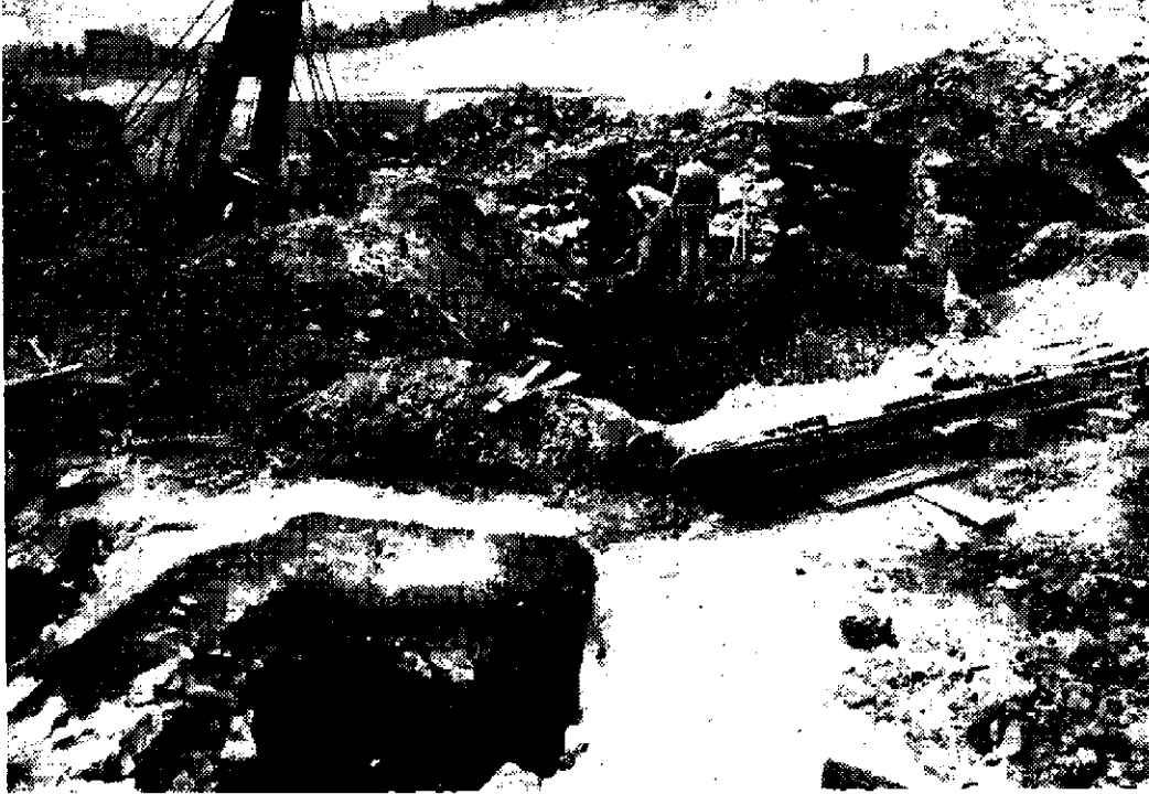
Obr. 1. Výzkum v historickém jádru města Mostu, léto 1977.