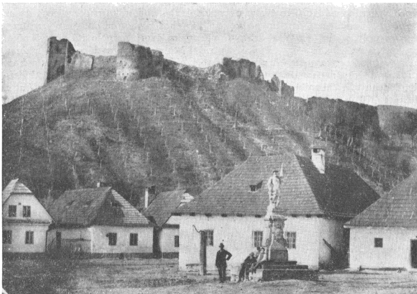
Obr. 1. Hrad Brumov. Celkový pohled z 2. poloviny 19. století.