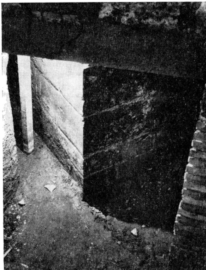
Obr. 3. Pohled na spodní část kvádrového piliře dřevěného mostu, dnes přístupnou ze sklepa domu čp. 379/I. (č. 016 plán domu v plánu č. 1 v tomto sborníku.) Pro Janu Vodičkovou foto Zdeněk Helfert 1971.

vzniku není známo. Tomek uvádí vznik asi k roku 1362, Lorenc v rozpětí mezi léty 1359 až 1361. (Tomek I., 1866, s. 124. Tomek-Dějepis II, 1871, s. 137. Ruth, 1903, s. 603. Lorenc 1973, s. 124, 125). Lorenc publikuje též v cit. díle rekonstrukci původního půdorysu i řez basilikou.