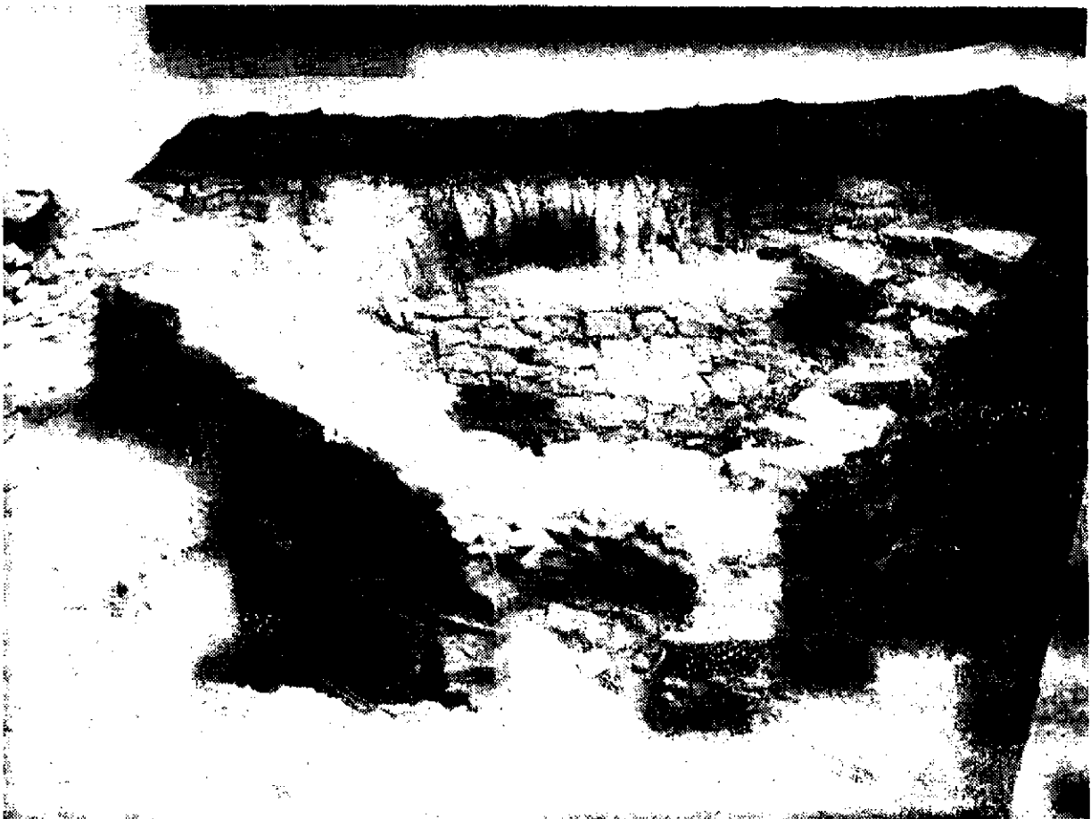
Obr. 2. Holíč – loretónska kaplnka. Odkryté juhozápadné nárožie staršieho sakrálnego objektu so vstavaným poľom oktogónu.