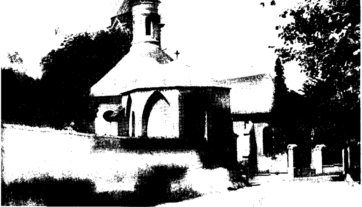
Obr. 1. Holíč – loretónska kaplnka. Pohľad na skúmaný objekt od juhovýchodu – v pozadí farský kostol.