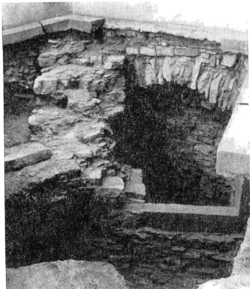
Obr. 3. Holíč — loretánska kaplnka. Odkryté severozápadné nárožie staršieho sakrálneho objektu so zviazaným oporným pilierom a pôvodným vstupom do podzemného priestoru.

obdĺžnikového pôdorysu s vnútornými rozmermi 650—910×830 cm, ukončený na východe jednoduchým trojbokým polygonálnym uzáverom (obr. 4). Objekt s takmer úplne zachovalým kamenným základovým murivom (širokým 130 cm), zapusteným do značnej hĺbky a spevneným v štyroch nárožiach zviazanými operákmi bol v celom svojom rozsahu dvojpodlažný. Nadzákladové, takmer kvádrikové murivo, zachované do výšky 110 cm patrilo ešte spodnému priestoru. Vstup do hornej časti sa nezistil. Zo vstupu do podzemného priestoru sa odkryla in situ spodná časť kamenného portálu jednoduchého štvorhranného profilu, pripúšťajúca najvrchnejšiu hranicu datovania do 13. storočia.