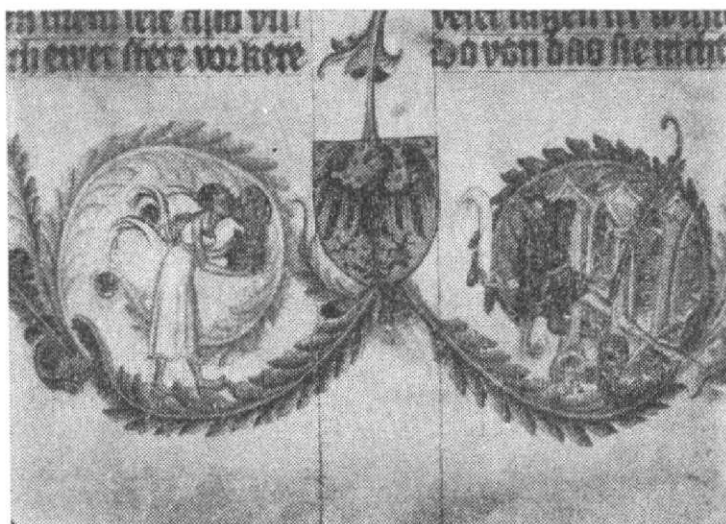
Obr. 7. Bible Václava IV., uložena ve Vídni, fotokopie miniaturní výzdoby, foto SÚPPOP.