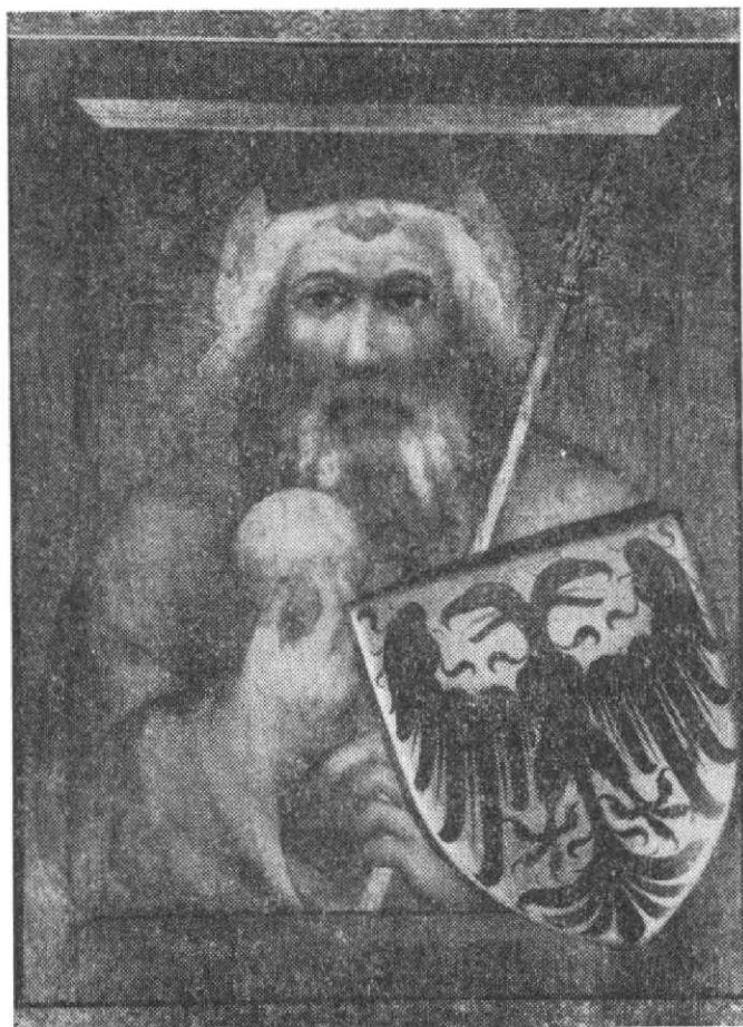
Obr. 8. Mistr Theodorik, Karel Velký z kaple sv. Kříže na Karlštejně, foto SÚPPOP.