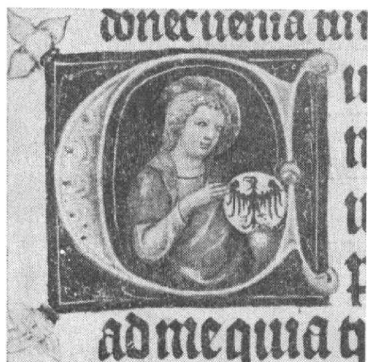
Obr. 6. Liber Vlticus Jana ze Středy, fol. 268b, sv. Václav v iniciále, foto M. Fokt.

c) Reliéfni plastika: Souhrnně lze říci, že erby s orlicemi opolskou, slezskou, svídnickou a moravskou z erbovního sálu na hradě Laufu u Norimberka (někdy okolo 1360 výzdoba; Kraft—Schwemmer 1960, 9 a 45 sq, tab. XII) se příliš neliší od orlic ze svatovítského triforia (Kalista—Funk 1946, 16 a 19 sq, obr. 7, 10—12, 15), jež bývají datovány do 70. let 14. století, nebo mostecké věže, okolo r. 1380. Tyto orlice hledí převážně vpravo s hlavou vodorovně postavenou a křídly více méně svislými, či mírně zahnutými na koncích. Na hradě Laufu se ovšem zachovala i polychromie.