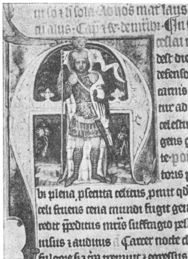
Obr. 5. Liber Vlticus Jana ze Středy, fol. 87b, sv. Jan v iniciále, foto M. Fokt.

Karla Velikého a sv. Václava, z let 1357—1367 (in Friedl 1956, 25 a obr. 83, 84 a 86) (obr. 8).