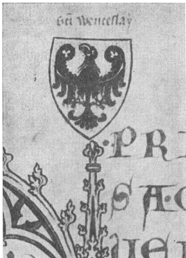
Obr. 4. Passlonál abatyše Kunhuty, fol. 1b, svatováclavská orlice, detail, foto M. Fokt.