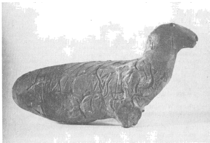
Obr. 5. Stredoveká hlinená plastika. Nález vo dvore kostola Všetechsvätých.

Najpočetnejším nálezovým materiálom, získaným archeologickými výskumami, prieskumami a zbermi bola keramika najčastejšie vo fragmentoch. Z celých a rekonštruovaných predmetov z pálennej hliny sa získali hrnce, krčahy, zásobnice, pokrývky, misky, kahance, praslensy, kachlice a nechýbala ani keramická plastika (obr. 5). Najpočetnejšie sú zastúpené pokrývky, pozornosť si zasluhuje keramika z 12.–13. storočia, časti hrubostenných zásobníc, ukážky gotických pohárov a kach-