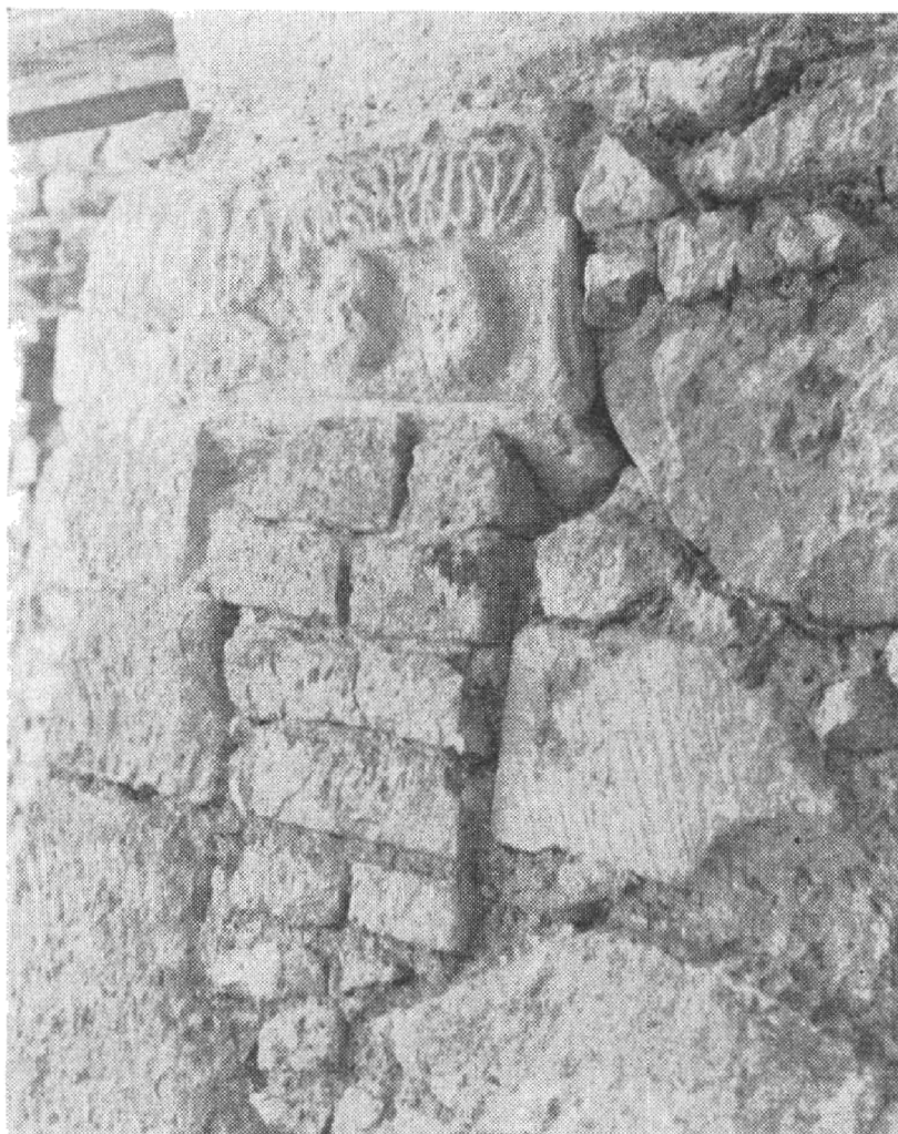
Obr. 2. Severovýchodné nárožie veže so sekundárne zamurovanou reliefnou hlavícou z 11. storočia.

Pri plošnom odkryve sme zistili existenciu značného množstva sekundárne použitých kamenných profilovaných článkov, ktoré pochádzali zo starších stavebných etáp. V týchto troch postupne budovaných stavbách, sme našli profilované neraz i polychromované kamene renesančné, zo 16. storočia, gotické zo 14. ev. zač.