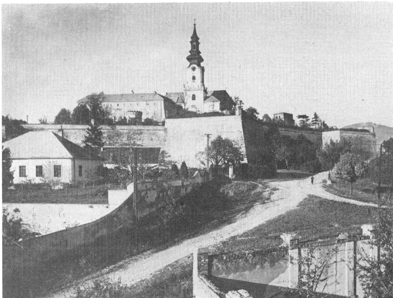
Obr. 1. Pohľad na areál nitrianskeho hradu s dominujúcou vežou. Foto 1955, archív ŠUPS.

Napriek tomu, že k Nitre sa viaže z 9. storočia pochádzajúci najstarší údaj o existencii kostola na našom území, dodnes ho nevieme bezpečne lokalizovať. Z architektúr zachovaných na hrade je zatiaľ najstaršia známa stavba tzv. Pribino-