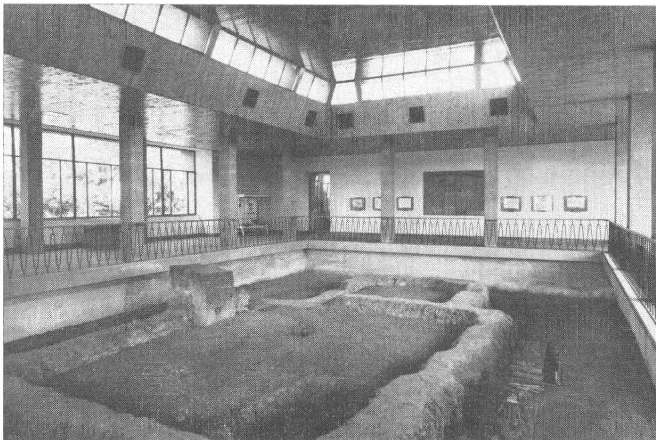
Obr. 1. I. Typ krycí stavby nad významnou archeologickou památkou. Staré Město u Uherského Hradiště – lokalita Na Valách. Nad nálezem dr. V. Hrubého z května r. 1949 jako nad první zjištěnou architekturou z doby Velkomoravské říše byla na sklonku padesátých let vybudována podle projektu akad. arch. V. Hradíla a ing. arch. M. Suchánka stabilní krycí stavba jako důstojný Památník Velkomoravské říše.