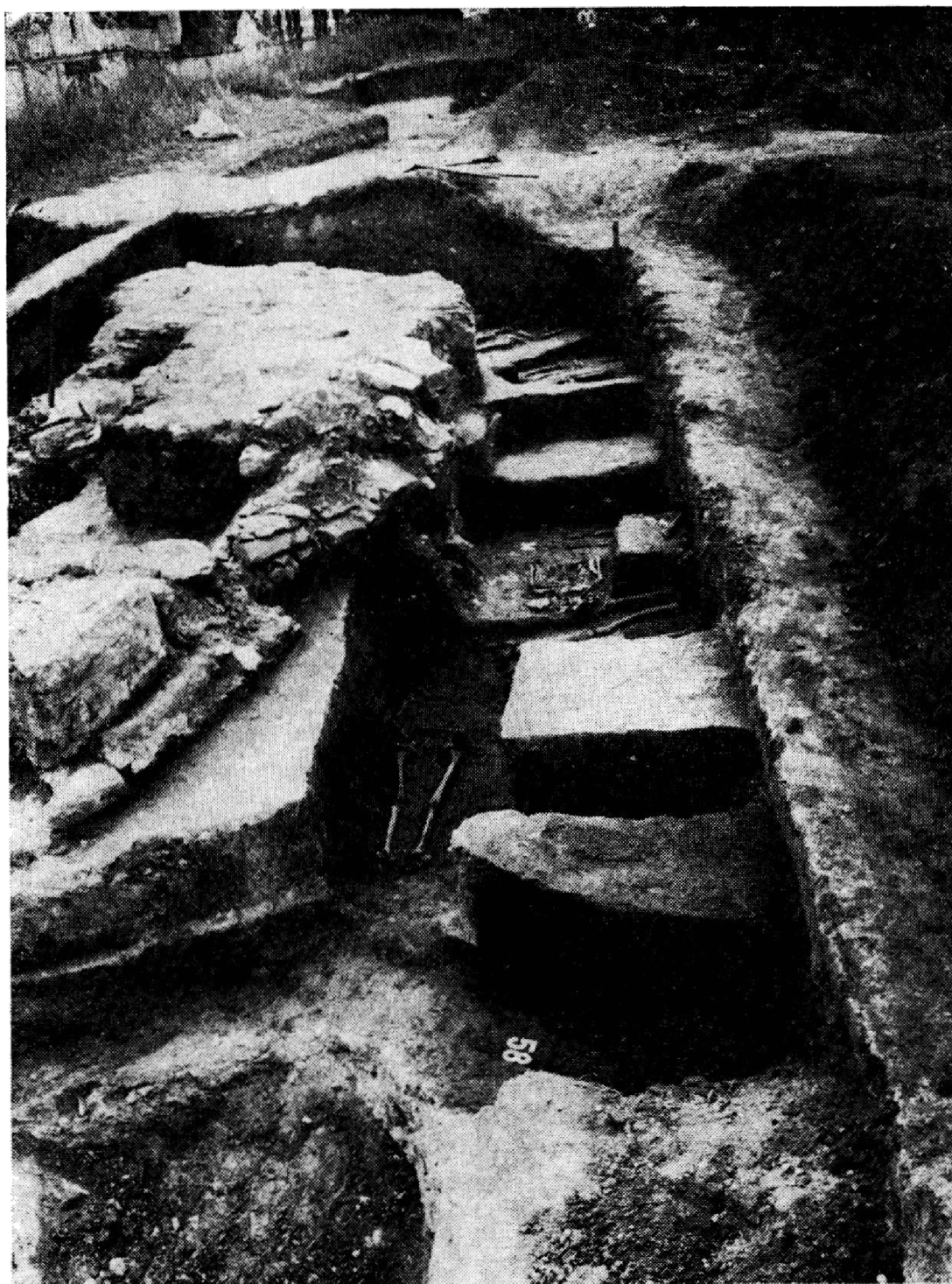
Obr. 1. Kežmarok — kostol sv. Michala (okr. Poprad). Pohľad na výskum západného uzáveru sakrálny stavby a cintorína.

V tomto roku sa začal realizovať aj druhý oveľa rozsiahlejší záchranný archeologický výskum v katastri obce Bajč, okr. Nové Zámky, v polohe Medzi kanálmi (Čaplovič—Cheben—Ruttikay 1988, v tlači), ktorý bol vyvolaný rozsiahlymi rekultivačnými prácami a planírovaním pieskových dún po oboch