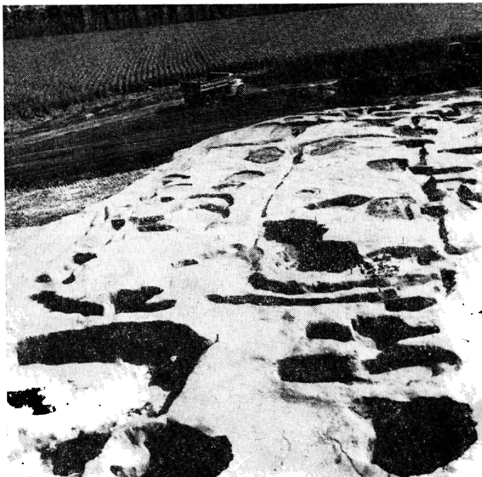
Obr. 2. Bajč, poloha Medzi kanálmi (okr. Komárno). Pohľad na odkrytý pôdorys žlabov — obdĺžnikovej, pôvodne nadzemnej stavby ľahkej konštrukcie.

stranách Žitavy nielen v polohe Medzi kanálmi (Vlhké lúky), ako aj v polohách Góre a Ragoňa, kde sa už v predchádzajúcich rokoch uskutočnili záchranné výskumy pravekého a včasnohistorického osídlenia, pre ktoré práve naviate pieskové duny poskytovali ideálne miesta k osídleniu v povodí rieky Žitava, ktorá sústavne meandrovala a tak menila svoje koryto. Na jednom z pieskových násypov (duny) sa zistili doklady intenzívneho pravekého osídlenia (z mladej doby kamennej: železovská skupina, a z neskoršej doby kamennej: skupina Kosihy-Čaka), ojedinelé dôkazy osídlenia z doby laténskej, včasnostredovekého osídlenia z veľkomoravského (9. storočie) a veľkomojavského (10. storočia) obdobia, ako aj z počiatkov vrcholného stredoveku (11.—12. storočia). V tomto roku sa preskúmala plocha okolo 2 000 m 2 , t. j. asi štvrtina celkovo ohrozenej osídlenej polohy. Keďže je potrebné uvoľniť celú osídlenú plochu v rámci zámerov rozsiahlej rekultivácie, vo výskume sa bude pokračovať aj v budúcom roku a tak iste bude možné vytvoriť si oveľa plastickejší a presnejší, vernejší obraz o sídelnom vývoji v priebehu 9.—12. storočia na tejto lokalite, a to už v porovnaní s výsledkami prieskumu celého mikroregiónu. Preto predložené výsledky je potrebné chápať informatívne a majú vyslovene pracovný charakter.