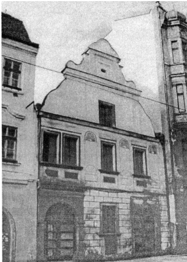
Ol>r. I. Plzeň (p. 89, hlavní průfili.

Řadový dům čp. 89 stojí v Pražské ulici, někdejší hlavní tepně středověké Plzně. Jeho významné poloze, zdá se, odpovídalo také společenské zařazení majitelů, které na počátku 15. století reprezentuje konšel Mikuláš kotlár (Strnad 1909, 61, Strnad ed. 1891, 284). Vývoj stavby pravděpodobně poznamenaly požáry, které město ničily na počátku šestnáctého století. Podle výpovědí Simona Plachého zTřebnice (Strnad ed. 1883, 103, 106) se můžeme domnívat, že se tak mohlo stát za požáru v roce 1507 a zejména pak roku 1526, kdy se připomíná, že požár postihl přímo lokalitu, na jejímž okraji se objekt nachází.