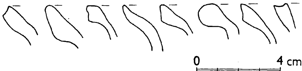
Obr. 3. Výběr z nejstarších keramických zlomků získaných při výzkumu na nádvoří Okresního musea v Rakovníku, nám. Jana Žižky, čp. 1.

Z výsledků archeologických výzkumů vyplývá, že část území dnešního Rakovníka byla ve středověku osídlena nejpozději v mladší fázi 1. poloviny 13. století. Na základě našich poznatků můžeme dále vyslovit několik poznámek k počátku města (za cenné pod-