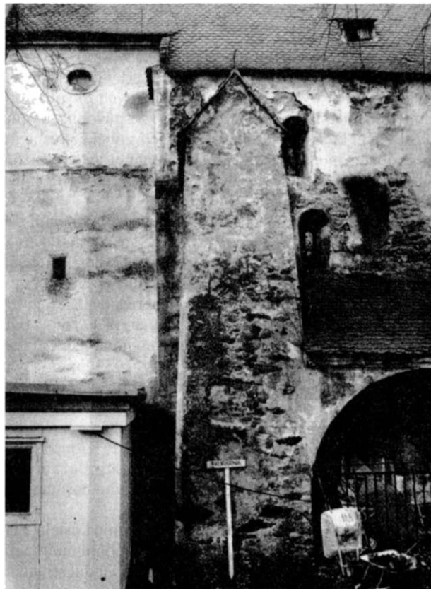
Obr. 1. Horní Stropnice, kosci sv. Mikuláše. Jihozápadní nároží lodi, armované kvádry s konzolou, původní podpírající palu západního Slitu. Nad konzolou armatura nadstavby. Napravo od pozdějšího opěrného pilíře západní okno lodi a nad ním okno nadstavby.

Postupem času byl stavební organismus kostela obohacen vložení pozdněgotického sinového trojlodí do prostoru poněkud zvýšené původní lodi a připojením několika přístavků z nichž vynikají zejména kaple sv. Kateřiny na severní straně chórové věže a západní věžová předsíň. Již od minulého století byla v popisech kostela věnována pozornost empoře v západní části lodi, podklenuté dvěma poli křížové klenby bez žeber, spočívajících na celkem šesti masivních pilířích, totiž na jednom volném v ose lodi a na dalších pěti přístěnných a koutových, navzájem spojených půlkruhovými neprofilovanými pasy.