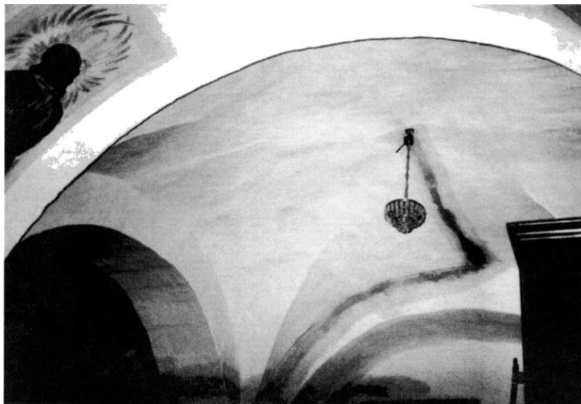
Obr. 3. Křížová klenba bez žeber pod emporou.

rozápadním nároží další, z níž však zbyla sotva zřetelná bosa. Lze z toho dovodit, že tyto konzoly podpíraly štít, mezi nimiž byla zapašována sedlová střecha lodi způsobem obvyklým u románských podélných kostelů (Radová 1977, 96).