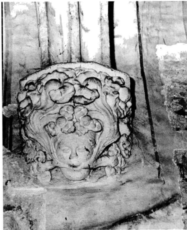
Obr. U. Konzola s divým mužom v chóre z 2. fázy.

Azda i tým, že k druhej stavebnej vrstve (druhej gotickej) nie sú známe písomné pramene, v doterajšej umelecko-historickej literatúre jej časové vymedzenie nie je zjednotené. Henszlmann slohovo jednotné články rozdelil dokonca na dve skupiny: konzoly hoci presne nedatoval, určil ich výskyt od konca 13. storočia až po 16. storočie; rebrá klenby so vstupným severným portálom začlenil na koniec 15. storočia. (Henszlmann, 1880, 218-219). Autori v trnavskom jubilejnom zborníku tiež nenašli spoločný názor: Postényi kládol gotickú svätýňu s bránou do 15. storočia (Postényi, 1938, 89), Loubal do 14. storočia (Loubal, 1938, 133). Príbuzný dátum uviedol i A. Jursa, bližšieho však vymedzil do jeho druhej polovice, s tým, že na kostole okrem iných detailov, sa zachovali datujúce okná s trojlístovou kružbou, dnes na kostole neevidentné (Jursa, 1957, 101). O profilovaných gotických oknách sa zmienil i Súpis pamiatok na Slovensku s určením gotickej stavby do 14. storočia (Súpis, 1969, 319). Viac ráz sa datovania gotickej prestavby klarisiiek dotkol V. Mencl: jeho staršie vročenie sa vzťahuje na prvú polovicu 14. storočia, keď kládol klariskú prestavbu do doby vzniku kostola sv. Heleny v Trnave (Mencl, 1938, 48), novšie sa kostola dotkol v publikovanom posudku dizertačnej práce J. Bureša, s datovaním presbytéria do druhej štvrtiny