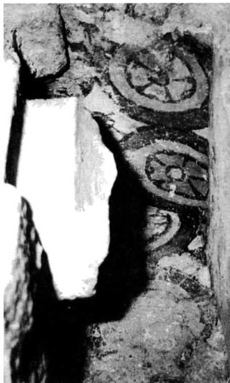
Obr. 8. Výmaľba s dielcami. Fázy

Na základe situovania kostola klarisiek v mestskom urbanizme, možno usudzovať o kodifikácii mestského pôdorysu a jeho celkovom charaktere v dobe udelenia mestských privilégií v r. 1238. Význam Trnavy podčiarkuje práve aj skorá prítomnosť mendikantskej rehole - klarisiek, s príchodom ihneď po tomto dátume, lebo už 22. mája 1239 ich pápež Gregor IX. v najstaršom zachovanom doklade potvrdil a zbral pod ochranu (Roháč, 1989,