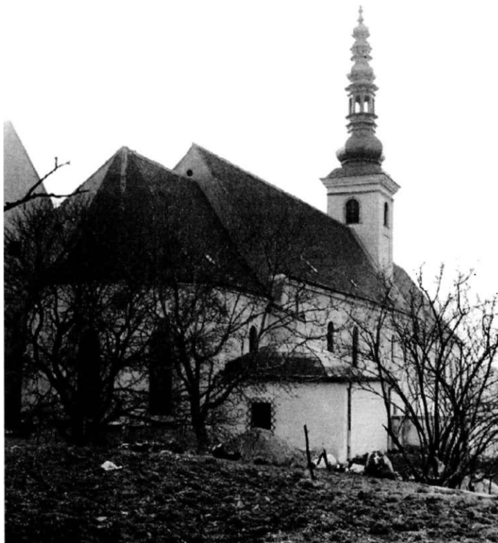
Obr. 1. Trnava, bývalý kostol klarisiek, pohľad zo severovýchodu