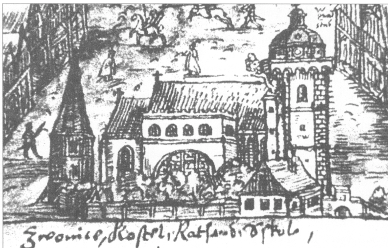
Obr. 6. Farský kostol sv. Alžbety s radnicou, detail Willenbergovej veduty z roku 1599.

Finančne nákladná prestavba radnice v cene 13 florénov je doložená v mestských účtovných knihách v roku 1511. V nasledujúcom roku 1512 sa uvádza výmaľba radnice miestnym remeselníkom Abrahámom Braxatorisom. V roku 1513 bol vyplatný finančný obnos zámočníkom za opravu zámky a majstrovi Jánovi 4 florény za osadenie okenných vitráží. V mestských knihách sú uvedené záznamy o dopĺňovaní interiérového mobiliáru najmä radničnej siene, o ktorej sa dozvedáme, že v roku 1513 tu bola inštalovaná kachľová pec hrnčiarskym majstrom Lukášom v cene 4 florény a 25 denárov.