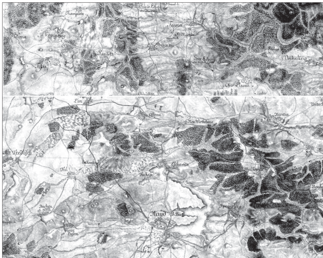
Obr. 2. I. vojenské mapování – josefské (výřez), 1764–1768 a 1780–1783 (rektifikace), měř. 1 : 28 800.