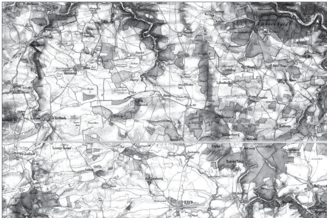
Obr. 3. II. vojenské mapování – Františkovo (výřez), 1836–1852, měř. 1 : 28 800.