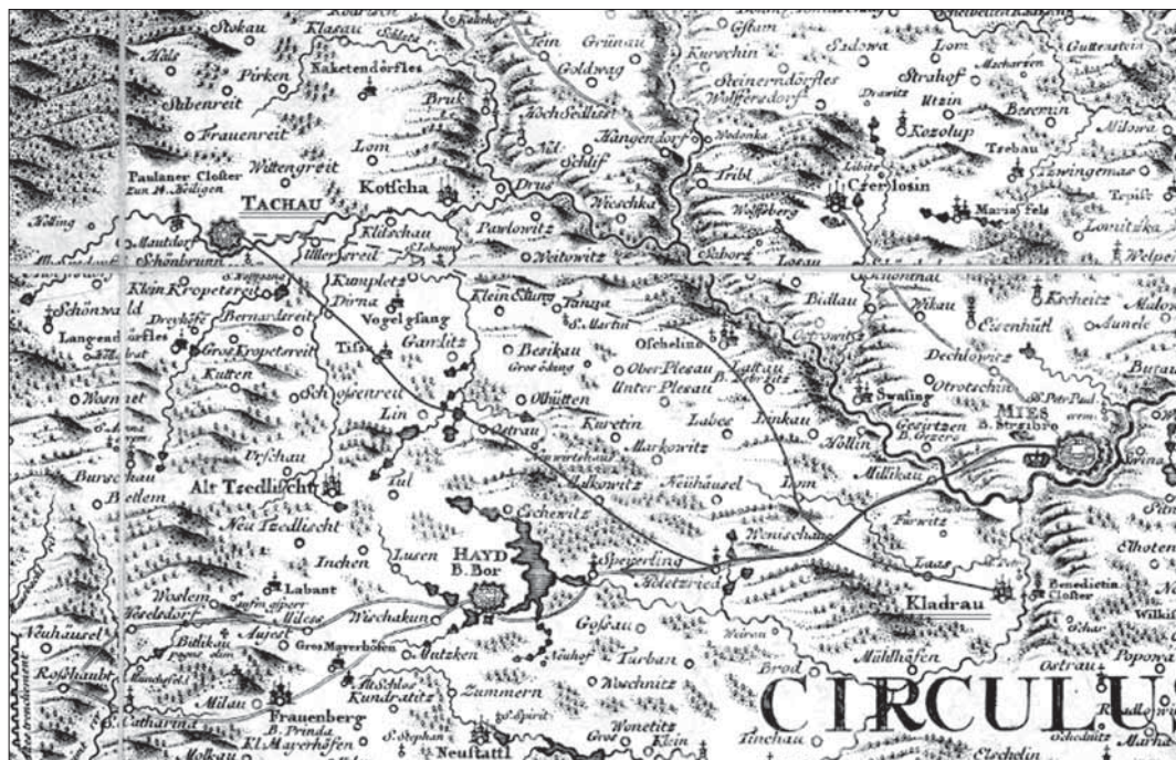
Obr. 1. Průběh tachovské a přímdské větve Norimberské cesty na Müllerově mapě Čech z roku 1720. Červeně značen průběh tachovské větve ve 12. století, zeleně značen průběh tachovské větve ve 14. století.