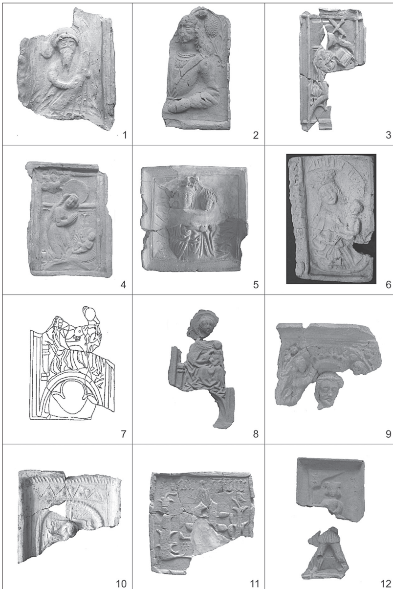
Tab. 1. Náboženské motivy: 1 - Neznámý prorok, Opava, Horní náměstí, 15/16. stol. (SZM); 2 - prorok Daniel, Jánický vrch u Javorníka, 15/16. stol. (VMJ); 3 - Zvěstování, Cvilín, 2. pol. 15. stol. (SZM); 4 - Panna Maria nad Ježíškem (Zbožná matka), Jánický vrch u Javorníka, 2. pol. 15. stol. (VMJ); 5 - Panna Maria s Ježíškem v aureole, Cvilín, 15/16. stol. (SZM); 6 - Panna Maria s Ježíškem, Starý Bohumín, poč. 16. stol. (Archaia, o. p. s. Olomouc); 7 - Panna Maria s Ježíškem (Královna nebes), Opava, Kolářská ul., 2. pol. 15. stol. (NPÚ, ú. o. p. v Ostravě); 8 - Panna Maria s Ježíškem (Královna nebes), Cvilín (SZM); 9 - Panna Maria korunovaná anděly (Královna nebes), 15./16. stol., Cvilín (SZM); 10 - Panna Maria - Ochránitelka, Ostrava, Masarykovo nám., 1. třetina 16. stol. (NPÚ, ú. o. p. v Ostravě); 11v Nápis „maria mater“, Cvilín, 2. pol. 15. stol. (SZM); 12 - sv. Václav, Cvilín, 15./16. stol. (SZM).