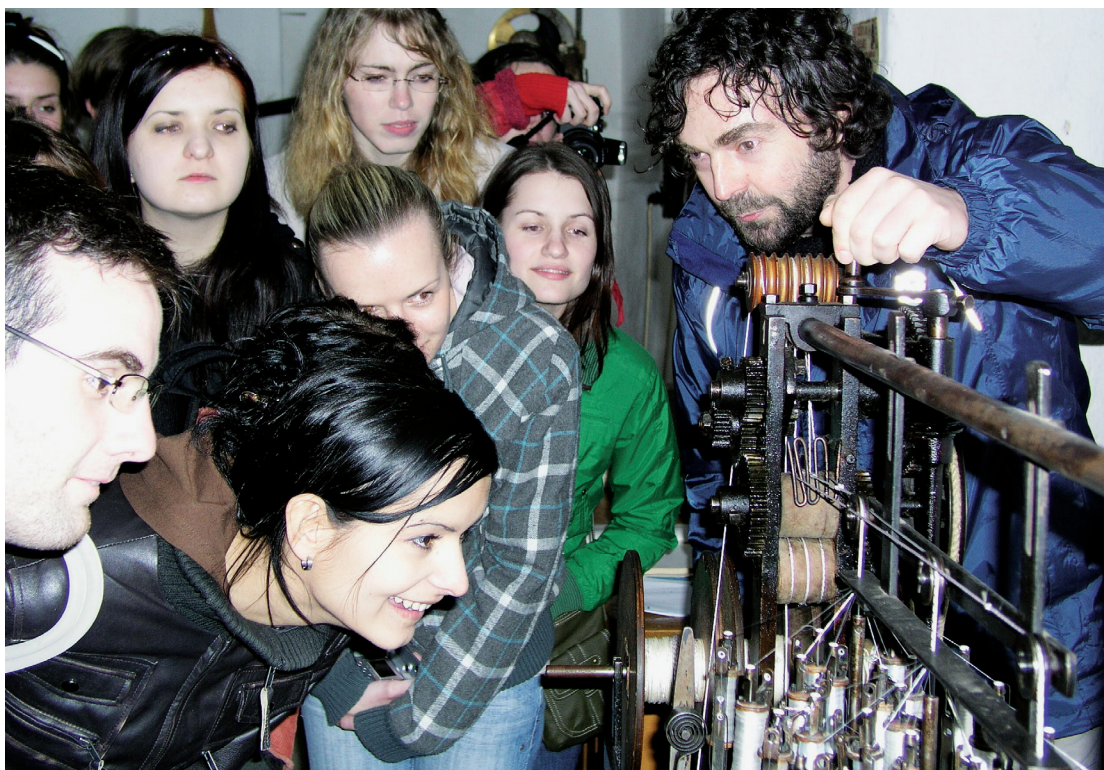
Studenti etnologie se seznamují s expozicí Provaznického muzea Karla Klika, 2008