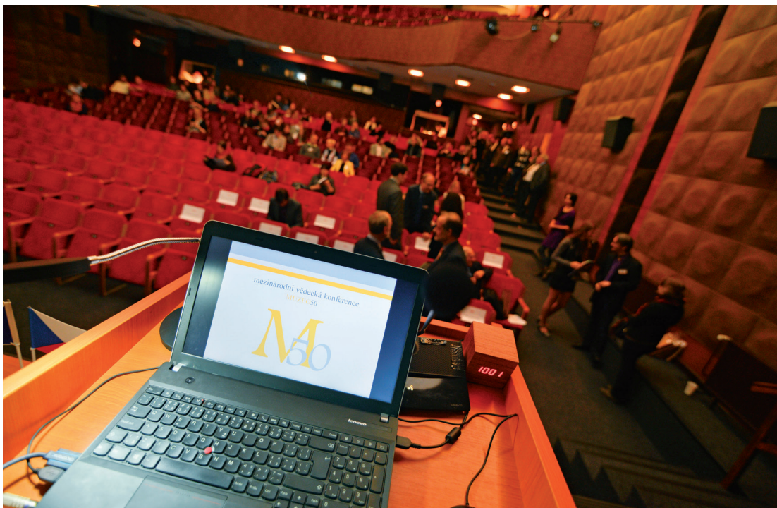
Konference Muzeo50 uspořádaná u příležitosti 50. výročí zahájení výuky muzeologie, Univerzitní kino Scala, 2014