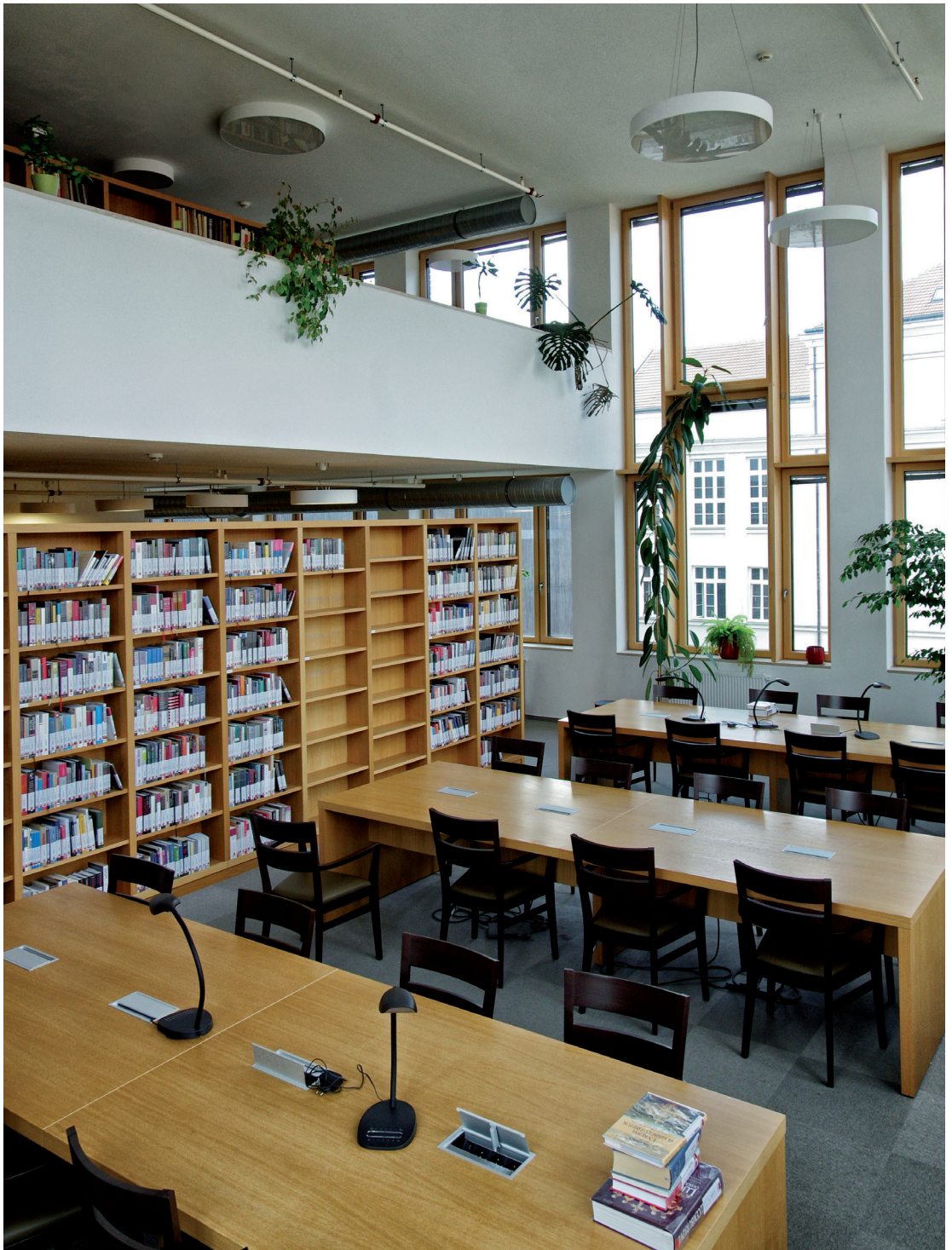
Nová knihovna Historického ústavu, 2018