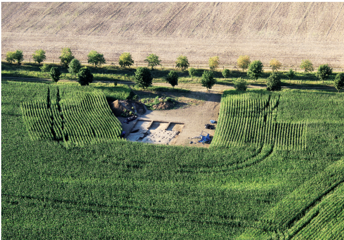
Letecký pohled na archeologické naleziště v Těšetících, 2013