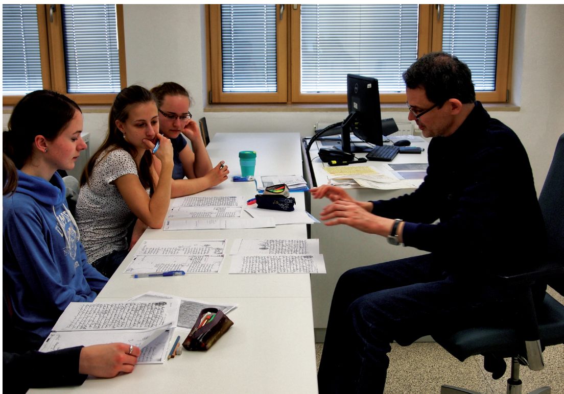
Paleografický seminář „Autografy 18.–20. století“ vedený D. Havlem, 2017