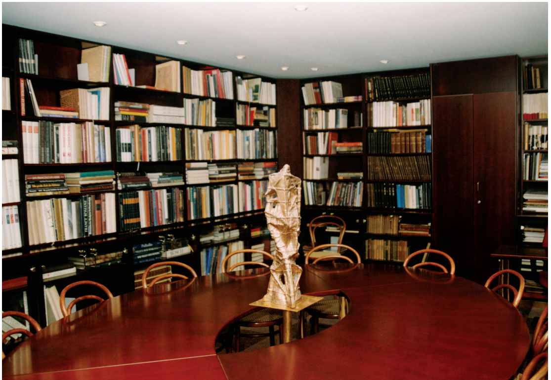
Gettyho knihovna v Semináři dějin umění vznikla díky velkorysému daru z prostředků „The Getty Grant Program“ v roce 1992