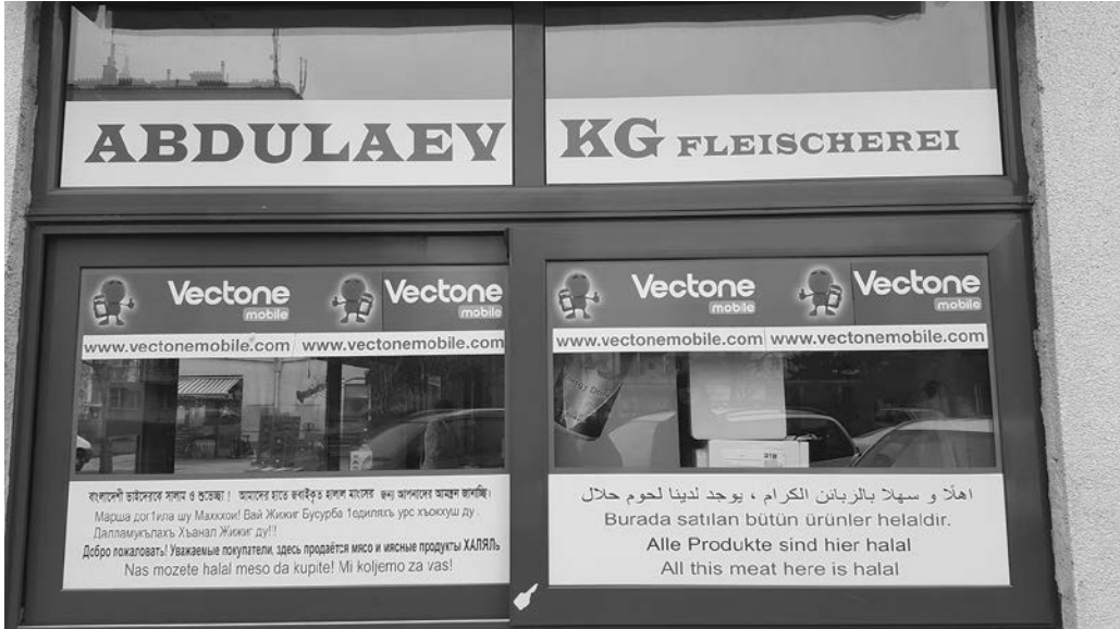
Abb. 4: Marktstand Brunnenmarkt

Internetprovider macht, und in mehreren Sprachen angibt, dass die Produkte „halal“ sind, eine wichtige Information für Kund*innen mit muslimischen Essensvorschriften. Wir erkennen hier auch die Adressierung spezieller Kund*innengruppen, also eine Spezialisierung für unterschiedliche „kulturelle“ Anforderungen, denn nicht nur die Marktstände sind divers, auch die Menschen, die auf Märkten einkaufen.