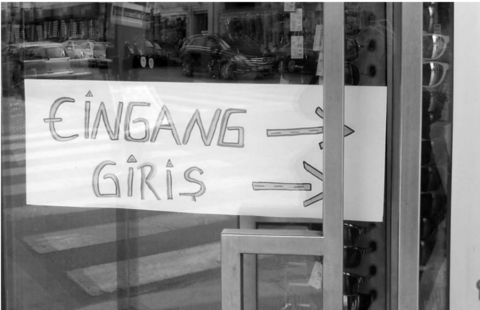
Abb. 3: Schild Brunnenmarkt

Die gleichzeitige Präsenz mehrerer Sprachen ist auch in diesem Bild zu sehen, Eingang und Giris , Deutsch und Türkisch.