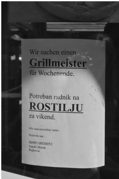
Abb. 5: Marktstand Hannovermarkt

mehr als 50 % der Einwohner*innen einen so genannten Migrationshintergrund aufweisen (Stadt Wien 2019), einer Stadt also, die wir als superdivers (Vertovec 2007) bezeichnen können. Wir sehen hier deutlich einen „grassroots multilingualism“ – eine Mehrsprachigkeit also, die nicht offiziell anerkannt, dennoch aber sehr produktiv ist (vgl. Pennycook Otsuji 2015: 13).