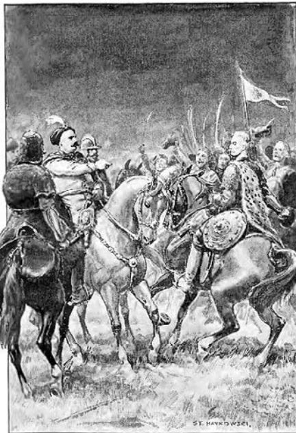
Król tymczasem zwrócił się do rotmistrza...

– A waść jutro po mszy, jeżeli spokój mieć będziemy, wraz z panem strażnikiem wojskowym zameldujesz się w moim namiocie! 25