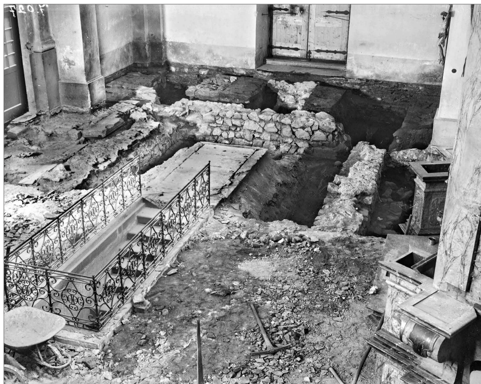
Obr. 6. Výzkum u západní zdi kostela, 1951.

Otázkou zůstává, zda o uvedeném výzkumu v západní části hlavní chrámové lodě vznikla shrnující nálezoř zpráva. Ječný již v roce 1962 konstatuje, že nálezoř zprávy z těchto prací se nenacházejí ani v archivu Archeologického ústavu, ani v oddělení evidence tehdejšího Ústavu