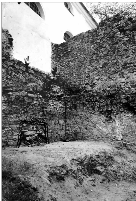
Obr. 2. Method Klement vyznačil vchod, kudy sám vstoupil do podzemí severní lodi kostela, 1947.

V dubnu 1948 shrnuje Jaroslav Böhme ve dvou zprávách komisi, které se na prosbu pátera Klementa s Ivanem Borkovským účastnil, a navrhuje, aby průzkum kostela pokračoval jednotlivými sondami. Také severní zahradu doporučoval vzhledem k velkému násypu pokrýt menšími sondami v termínu do září 1948 a nálezy dokumentovat. Ve skutečnosti se Method Klement do průzkumu severního prostranství pustil již v předešlé sezóně. Navedly jej snad poznatky z krypty a, jak sám tvrdí, také starší texty, které sem situovaly původní klášterní budovy (ARÚ, ANZ 4143/48; ARÚ, ANZ 4998/48; NA Praha, SPS). Sondy zachytily dvě zdi z domácího lomového kamene směřující na západ od východní terasové zdi, ve které byly identifikovány dva výklenky. U ohradní zdi nádvoří se objevila další z lomového zdiva, která je snad pokračováním zdi objevené roku 1940 u vstupu do severní chrámové lodi (Ječný 1962, 46–47).