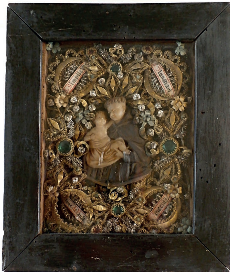
Obr. 6: Zasklená plastika sv. Antonína Paduánského, polychromovaný vosk tlačенý do formy, kolem výplň z dracounů, kamínků a perliček, 18. století. Tato dílka byla používána jako relikviáře, přesto byla nezdřídka přítomná i v měšťanských domácnostech.