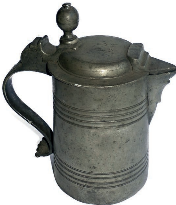
Obr. 4: Cínová holba z roku 1714 (v. 21 cm), běžný kus vybavení českobrodských domácností v době baroka. (Ze sbírek Podlipanského muzea v Českém Brodě)