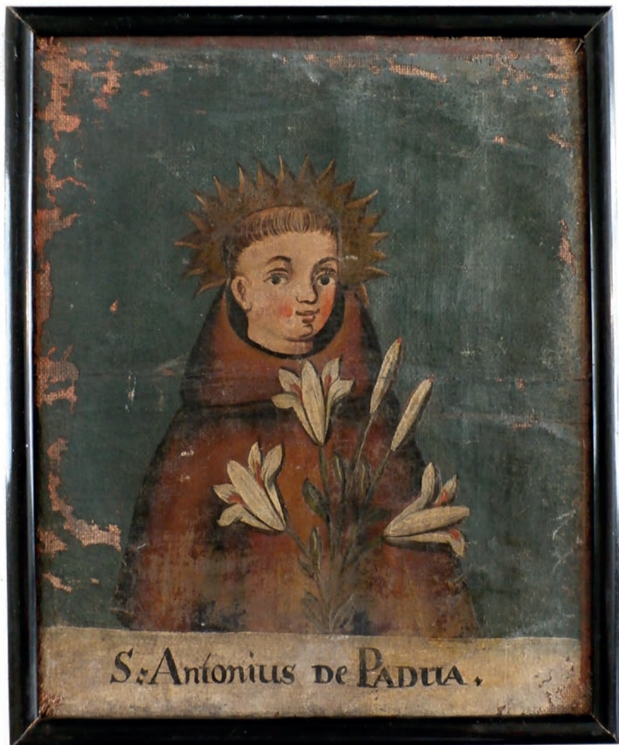
Obr. 7: Sv. Antonín Paduánský, olej na plátně, přelom 18. a 19. století. V pozůstalostních inventářích barokních domácností střední třídy čteme pravidelně seznam přítomných obrazů. Mnohdy se ovšem mohlo jednat i o dílo podobné kvality. (Ze sbírek Podlipanského muzea v Českém Brodě)