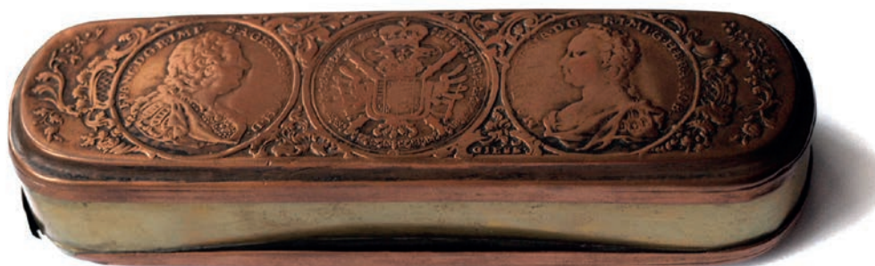
Obr. 3: Tabatěrka z měděného plechu s reliéfy podobizen Marie Terezie a Františka Štěpána Lotrinského, na druhé straně pohled na Prahu a po stranách popis významných budov. Možná souvisí s českou korunovací panovnice. (Ze sbírek Podlipanského muzea v Českém Brodě)