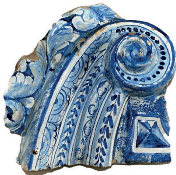
Obr. 5: Zlomek kachle z luxusních měšťanských kamen z neznámého českobrodského domu nám dokládá úroveň uměleckého řemesla v prostředí venkovského královského města. (Ze sbírek Podlipanského muzea v Českém Brodě)