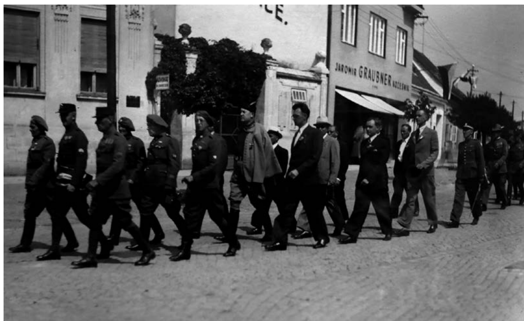
Branný sraz ve Strážnici ukazuje svornou spolupráci ve společném pochodu legionářských a nelegionářských veteránů.

Předáci sdružení se angažovali v přípravách a realizaci Husových oslav v roce 1925. Zmínku o jejich účasti na oslavách narozenin T. G. Masaryka však v tisku nenajdeme. Zůstává otázkou, zda se jedná o náhodu, nebo cílený bojkot. Můžeme však odvodit, že historické motivy hrály pro členy sdružení větší úlohu než osobnosti zahraničního odboje. Patrně se nejednalo o homogenní skupinu mužů. Jako poslední veřejné vystoupení na stranách denního tisku můžeme označit článek odsuzující nárůst fašistických tendencí v české společnosti, po jehož uveřejnění vydávání věstníku skončilo. 54 Můžeme prozatím pouze spekulovat, zda došlo k vnitřnímu názorovému rozkolu, nebo vydávání věstníku ustalo z objektivních důvodů nedostatku časových nebo finančních prostředků.