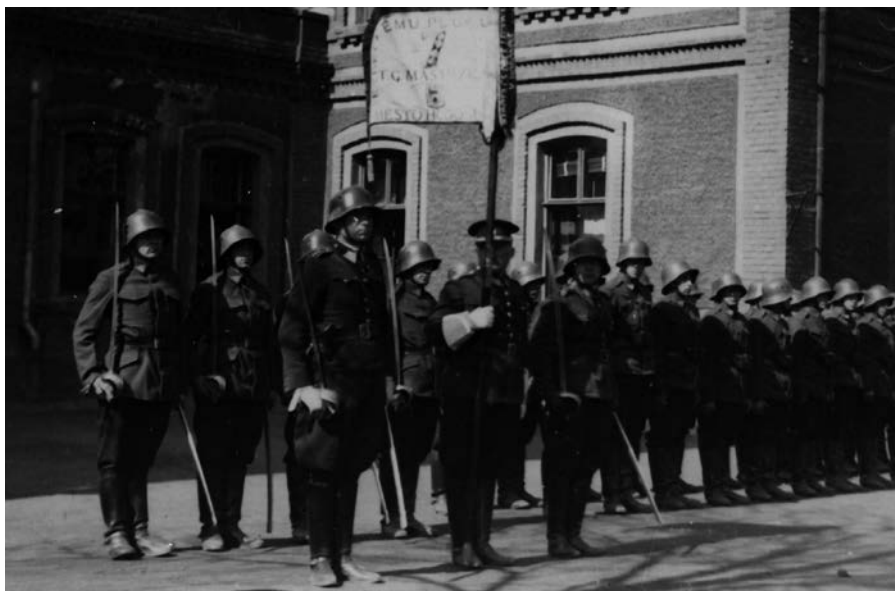
Dragouni od 7. jezdeckého pluku T. G. Masaryka v Hodoníně s plukovní standartou

nebo Brně). 39 Patřičné pozornosti se dostávalo i českému patronu svatému Václavovi. Jednalo se však o spíše církevní svátek, kterého se účastnilo zejména civilní obyvatelstvo a legionáři-veteráni ve svých stejnokrojích. Teprve v roce milénia Václavovy tragické smrti 28. září 1929, kdy došlo k určitému „postátnění“ oslav, se ve větší míře zúčastnila i čs. armáda. 40 O dva roky později byl v tomto symbolickém datu odhalen památník čs. legionářům a T. G. Masarykovi v Hodoníně. 41 U armády naopak nikterak nerezonovala cyrilometodějská tradice. Zřejmě ne pouze kvůli své ryze církevní symbolice, ale také kvůli své malé bojovnosti. Vedle zmíněných svátků se nadále uskutečňovaly oslavy 1. máje. 42 Byly však i události, které jejich organizátoři nepřimkli k určitému významnému datu (např. předání standarty 7. jezdeckému pluku T. G. Masaryka v Hodoníně 8. června 1930). 43