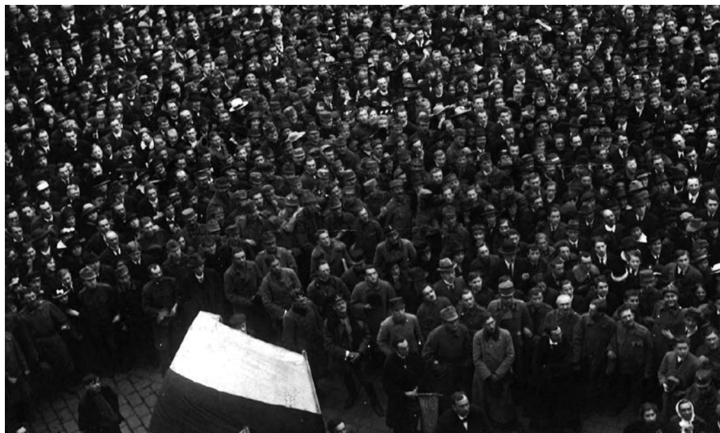
Na snímku z doby vyhlášení Československa jsou hojně viditelní muži ve vojenských stejnokrojích skomírající rakousko-uherské monarchie.

ubikace a výcvik. Před odjezdem do vlasti (na jaře 1919) byli vyzbrojeni a vystrojeni z kořistních rakouských zásob. Přijížděli do Československa, aby nahradili vyčerpané a místy demoralizované jednotky domácího vojska při střežení státních hranic, německojazyčného území českých zemí a část se ocitla také v bojích na Slovensku. V této složce rodící se čs. armády bychom našli také zástupce národnostních menšin (mimo jiné českých Němců).