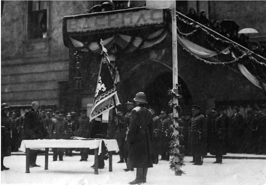
Ukázka další z oslavovaných bitev čs. legií v Rusku – 10. výročí bitvy u Bachmače v Olomouci (sbírka autora).

a chladným počasím evokoval náladu tryzny, zatímco červencové výročí Zborova svádělo k opravdovým oslavám. Přestože výročí vycházelo na 2. července, podařilo se do něj zapojit i školní mládež. Různé akce zaměřené na žactvo (k nejznámějším patří Zborovský závod branné zdatnosti) se konaly již v průběhu června, na konci školního roku. Nemělo by zůstat bez povšimnutí, že i pluk navazující na italské tradice (32. pěší pluk v Košicích) raději zvolil pro slavnostní ceremonii předání praporu datum bitvy u Zborova. 36 Není to však pravidlem. Turnovský 44. pěší pluk obdržel prapor v den narozenin T. G. Masaryka. 37