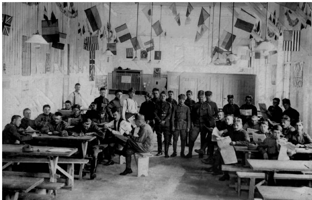
Snímek ze společenské místnosti určené k výchově, vzdělávání a zábavě vojáků.

Blížkost dat výročí bitvy u Zborova (2. července) a upálení Jana Husa (6. července) nabízelo propojení těchto oslav. V roce 1919 naplno zvítězil Hus. Zborovská legenda ještě nebyla natolik rozšířená. Ruští legionáři prozatím brázdili Sibiř a ve vlasti se jich nacházela jen hrstka. Titulní list Bratrství z 3. července 1919 přináší 4 články věnované Husovi, zatímco Zborov je zmíněn pouze na okraji „vpravo dole“. Ovšem i článek o Zborovu je úzce spojený s tematikou Husova svátku. I v roce 1920 jednoznačně převládaly Husovy oslavy nad připomínkou bitvy u Zborova. 19 K obratu dochází teprve v roce 1921 po návratu zbytku čs. legionářů z Ruska, kdy na stranách Bratrství vítězí Zborov. 20