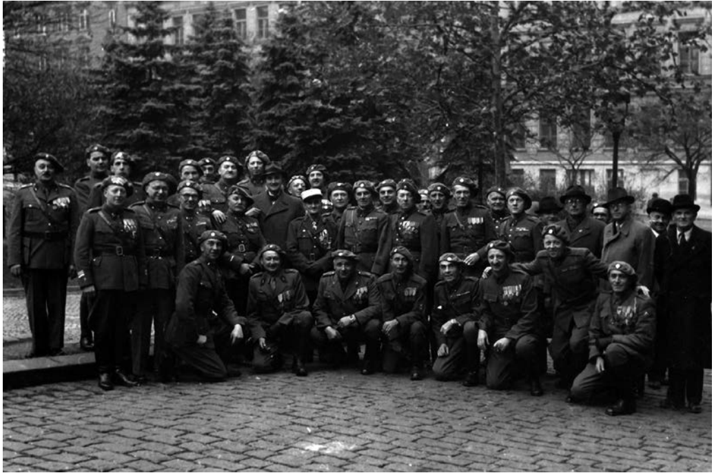
Veteráni domácího vojska na jednom ze svých setkání.

1924 organizovali ve spolku Sdružení bratří bývalého pluku Svobody č. III a jejich přátel. Valná hromada tohoto spolku proběhla v září 1924. 51 Jednalo se o funkční spolkovou platformu pro společné trávení času. 52 Sdružení pořádalo kulturní akce (plesy, přednášky), sokolská cvičení, ale též pěší turistické vycházky v okolí Brna. Spolek informoval širší členskou základnu i veřejnost o své činnosti prostřednictvím věstníků vycházejících jako součást periodika Moravský legionář . Tyto věstníky můžeme označit za poměrně útočné a mravokárné. Najdeme v nich kritiku společenských poměrů, politické scény i směřování vývoje státního aparátu. 53 Striktně se vymezovaly proti kuřákům a alkoholismu.