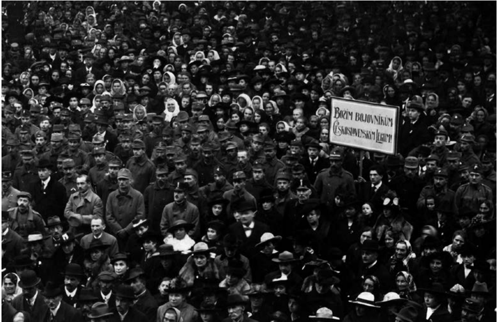
Dobová fotografie zobrazuje spontánní poděkování vlastenců československým legionářům.

schumlané – slovem ohyzdné. Kmeny stojí mnohde šikmo nakloněné, ježto půda se ssedla a stromek vychýlila z původní polohy; jinde je již stromek zlomyslníky poškozen, kozami ohlodán! 17