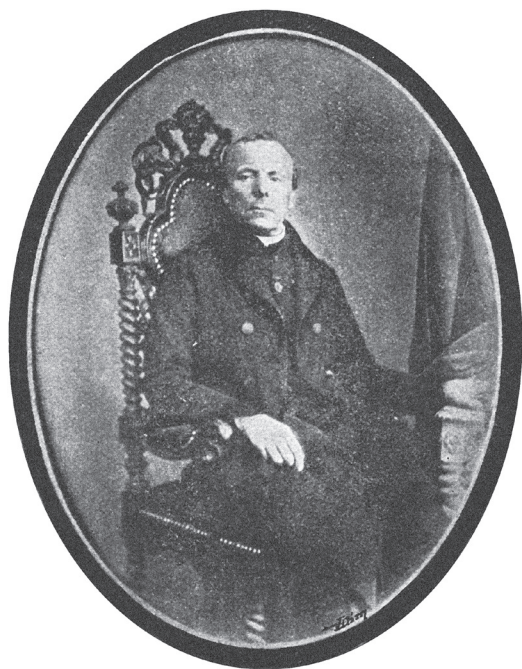
Obr. 10: František Sušil (1804–1868), profesor novozákonní biblistiky v Brně, zakladatelská osobnost národního hnutí na Moravě a inspirátor několika generací českého kléru

novozákonní biblistiky František Sušil (1804–1868) a jeho žáci, dozníval ještě po celou první polovinu 20. století. Nic na tom nezměnily ani občasně zákazy slovanských akademií ze strany církevních autorit, revoluční události roku 1848 a podezírání z šíření panslavismu. 221