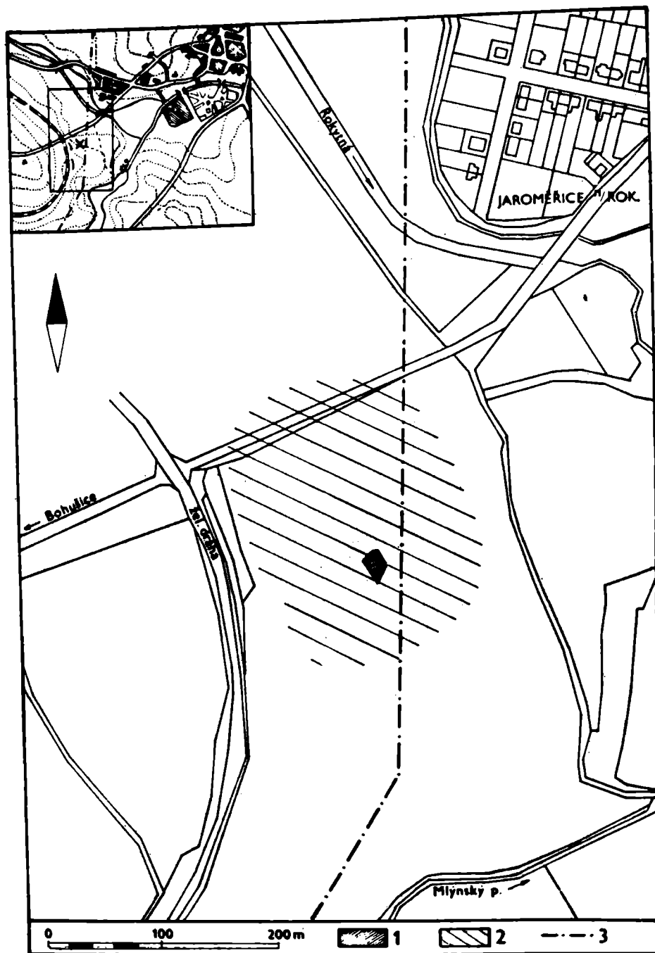
Obr. 1. Jaroměřice n. R. Situační plánec lokality s přibližným vyznačením rozsahu neolitického sídliště. (Kresba M. Bálek.)