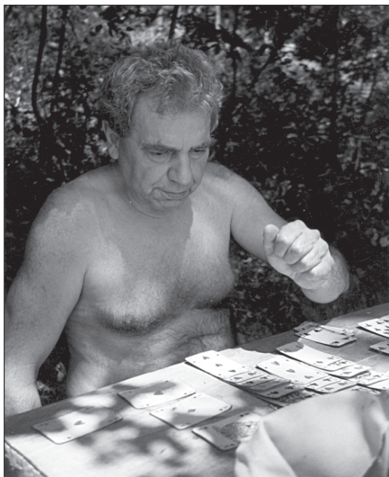
Krátké chvíle oddechu na milované chatě u Vranovské přehrady. Také sem vozil psací stroj a stohy papíru.