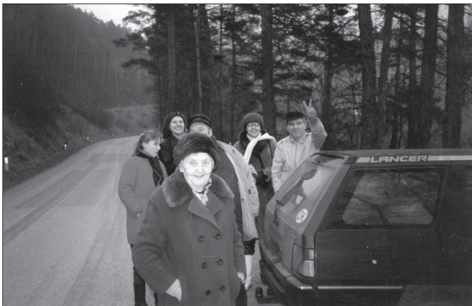
... A opět plány a očekávání: Silvestr po 20 letech – 1989 – s rodinou a Tesařovými na výletě za otevřenou česko-rakouskou hranici.