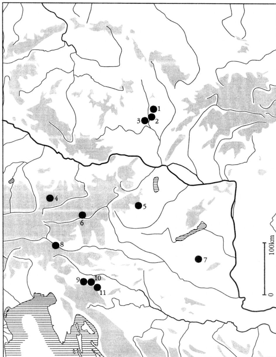
Obr. 1. Rozšíření rožňů s kruhovým zakončením ve východohalštatském kulturním okruhu.

čení (obr. 2:10). Ze slovinského Legenu pochází soubor železných tyčí, z nichž některé mohly být rožni (SRMČIK-GULIČ 1979, tab. 16:1–11). Železným rožněm by mohl být i exemplář ze Slovinska z Gríže (TERŽAN 1990, tab. 78:1).