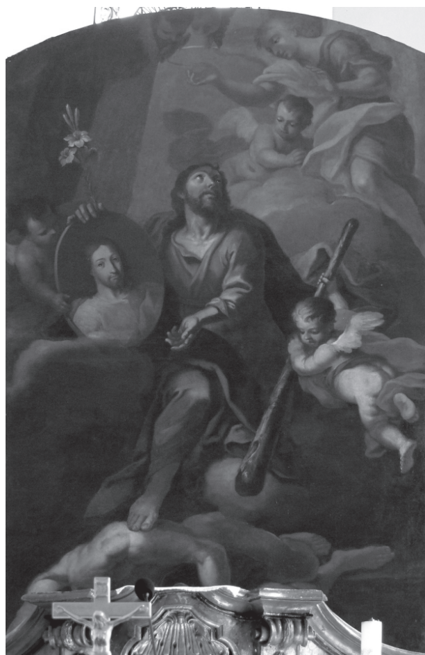
2 – Jan Kryštof Handke, Apoteóza sv. Judy Tadeáše , 1736. Gorzupia Dolna, filiální kostel sv. Jiří

Na tomto místě článek by mohl končit, nebýt překvapivého objevu ve skromném filiálním kostele sv. Jiří v Gorzupi Dolnej u Zaháně, 7 nález, který dovoluje soudit, že Handke ve své autobiografii zdaleka nevyjmenoval všechny malířské práce, které pro jezuitu v Hlohově vytvořil. Totiž, na hlavním oltáři skromného chrámu v Gorzupi se nachází velká olejomalba o rozměrech 255×155 cm, která znázorňuje apoteózu sv. Judy Tadeáše. [obr. 2] Světec je vyobrazen v dynamickém vykročení s pravou nohou na těle trýznitele s useknutou hlavou a pravou rukou na medailónu s popsím Krista, [obr. 3] jímž měl uzdravit syrského krále Abgara V. Ukkámu. Vzhůru zahleděného sv. Judu Tadeáše obklopují putti a andělé, z nichž jeden zasazuje trýzniteli úder kyjem, [obr. 4] pod jehož rány měl světec zemřít,