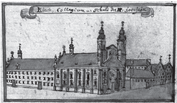
1 – Bernhard Friedrich Werner, Jezuitský kostel a kolej v Hlohově. Topographia Silesiae 2, 1768–1774, s. 49, Biblioteka Uniwersytecka we Wrocławiu

jedny z nejméně poznaných děl v tvorbě moravského umělce. Bezpochyby se nejednalo o velkou malířskou realizaci, což dokládá nízká částka honoráře. Kupříkladu Handke v roce 1728 obdržel stejnou odměnu za vytvoření fresky na klenbě nevelké kaple Božího Těla v bývalém jezuitském komplexu v Olomouci na ploše 230 m 2 . 4 Toto dílo se dodnes dochovalo, kdežto hlohovské malby v refektáři bývalé jezuitské koleje neexistují více než dvě století. Vážně poškozeny byly již v době slezských válek, ostatně stejně jako i celá budova jezuitské koleje. 5 V roce 1741 jezuitský komplex vyplenila pruská vojska a v letech 1742 a 1745 v sálech budovy koleje byl zřízen lazaret pro raněné rakouské zajatce. Od roku 1756 sloužily místnosti v přízemí a v horním patře jako sklad ovsu a refektář pytlů s moukou. V roce 1757 byl v budově koleje znovu zřízen lazaret, což nepřímo způsobilo, že dne 12. března 1758 vypukl požár, jehož následkem jak kostel, tak i kolej zůstaly bez střechy. Na konci roku 1758 došlo sice k provizornímu zastřešení, avšak hlohovští jezuité zatížení vysokými daněmi a tonoucí v dluzích nedisponovali prostředky na rekonstrukci poničených budov, které soustavně chátraly.