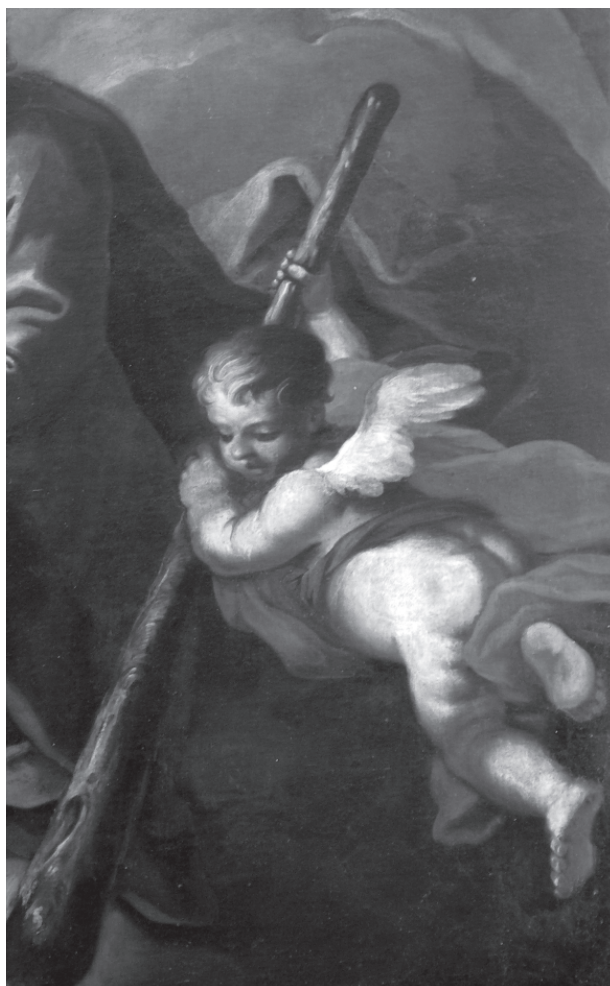
4 – Jan Kryštof Handke, Apoteóza sv. Judy Tadeáše – detail, 1736. Gorzupia Dolna, filiální kostel sv. Jiří

Bohužel pozdější osudy barokního zařízení jezuitského kostela byly téměř stejně tragické, jako dějiny budov jezuitské koleje. Kostel zpustošený za slezských válek, pouze s provizorním zastřešením, se po požáru z 13. března 1758 pro-