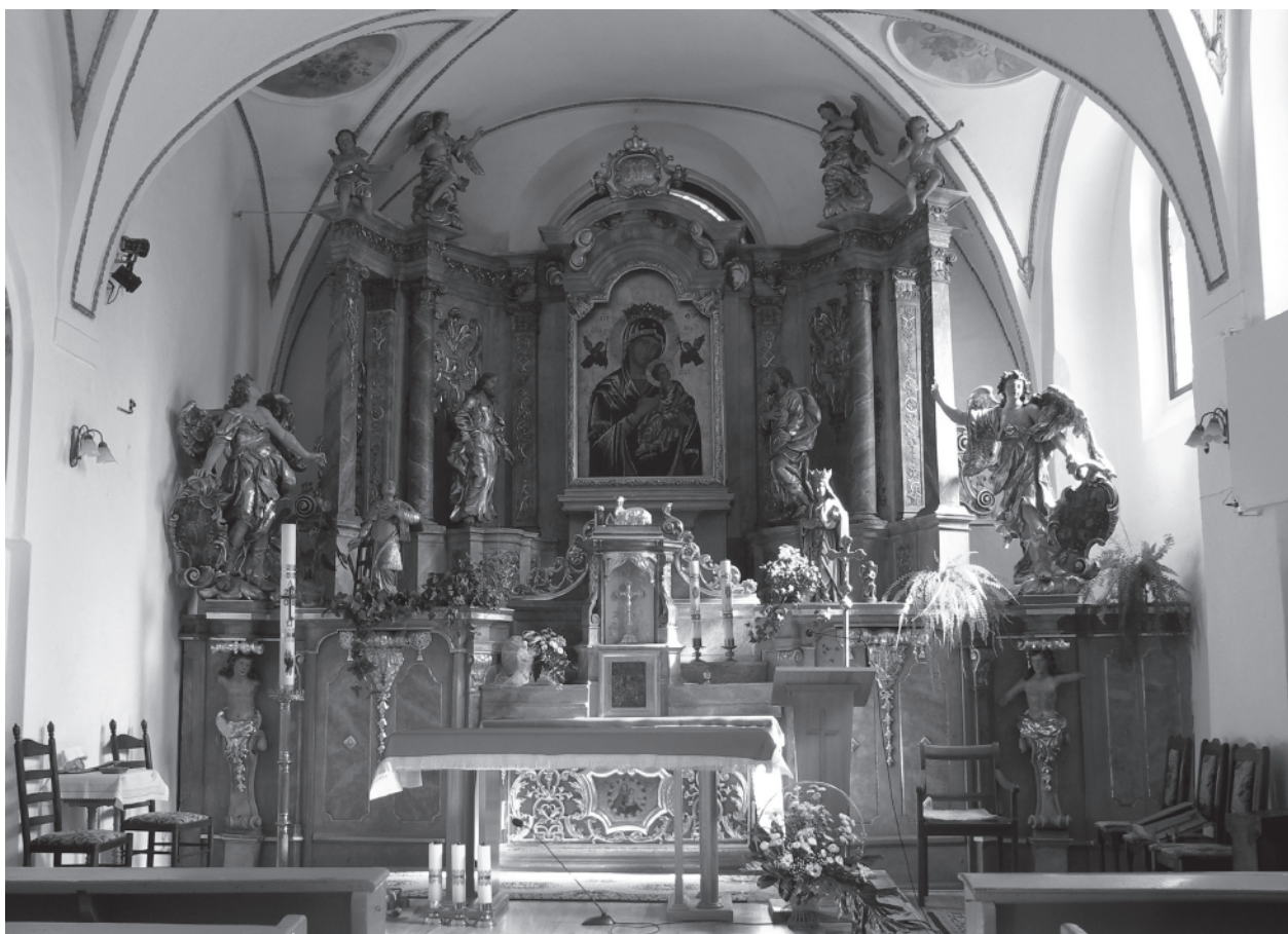
6 – Hlavní oltář . Hlohov-Brzostów, farní kostel sv. Vavřince

s červenou hvězdou v Minsterberku (Ziębice), který se dostal do farního kostela sv. Hedviky v nedalekém Krzelkově krátce potom, když byl na základě rozhodnutí pruského krále ze dne 24. ledna 1816 sekularizovaný minsterberský chrám předán městské radě za účelem jeho využití jako skladu píce pro místní jezdeckou posádku. 18 Tyto praktiky se děly také v Hlohově, čehož nejlepším dokladem je farní kostel sv. Vavřince v nedaleké obci Brzostów, dnešní čtvrti Hlohova, kam byl po roce 1810 získán nejenom znamenitý retábl z Růžencové kaple zaniklého dominikánského kostela sv. Petra v Hlohově,