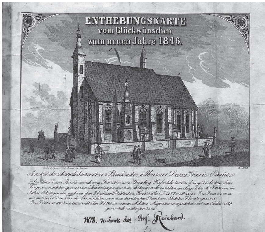
2 – Kostel Panny Marie na Předhradí, grafický list, 1846. Vědecká knihovna v Olomouci