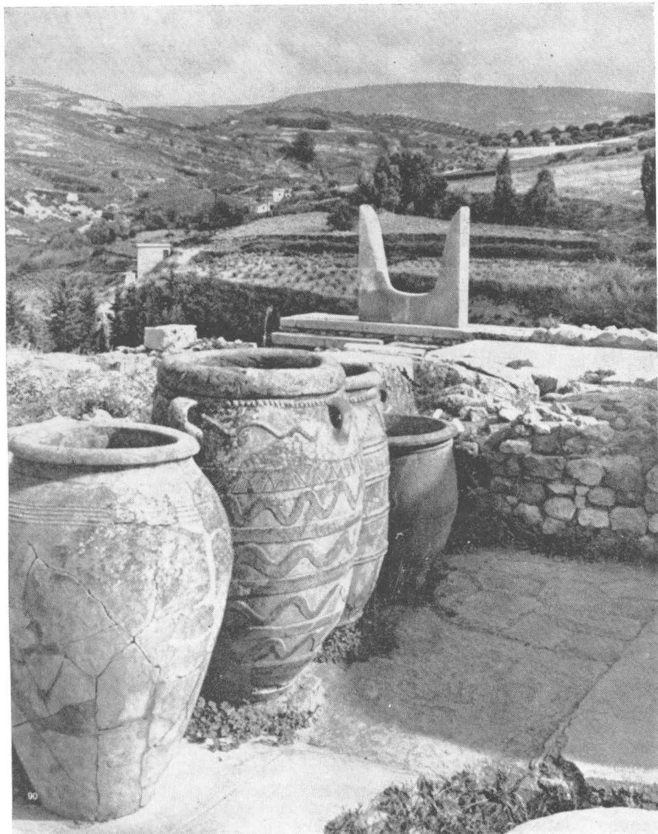
Tab. XXXII. Knóssos na Krétě, skladiště s velkými nádobami (15. stol. př. n. l.)

migračních přesunů po pádu mykénské civilizace zasáhly široké oblasti nářečně jen málo diferencovaného raně postmykénského světa. Jednou z nejstarších postmykénských hláskových změn byla asi disimilace aspi-