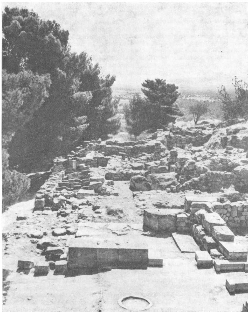
Tab. XXXIII. Faistos na Krétě, místo nálezu disku z Faistu (16. stol. př. n. l.)

(polovina 14. stol. př. n. l.?). M. Lejeune označuje tento úsek termínem „protomycénien“ a vyvozuje pro jeho časový rámeček z některých anomálií LB sylabáře a LB ortografie uskutečnění několika hláskoslovných změn. Tak anomální mykénská hodnota znaku č. 62 PTE ukazuje na